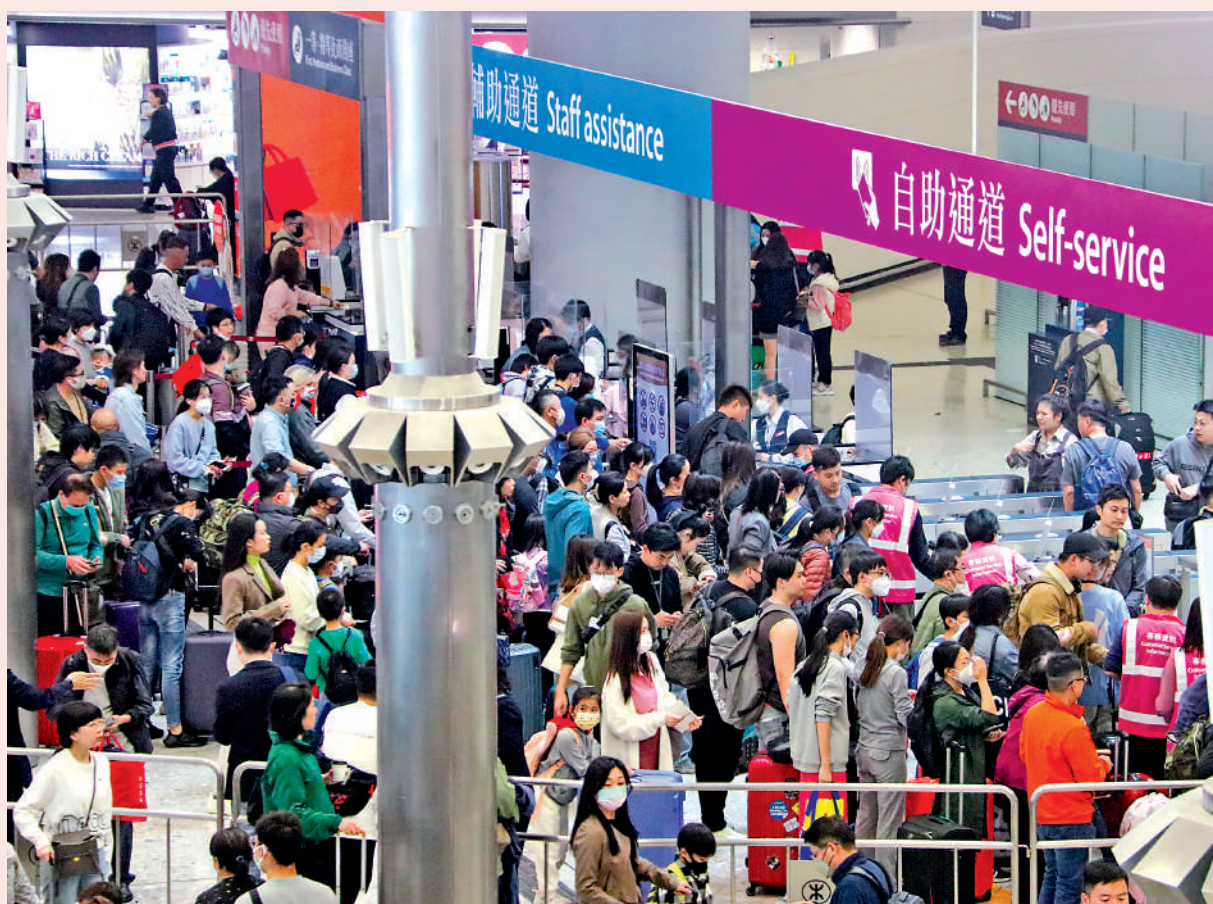
▲廣深港高鐵路香港段的長途服務全面恢復，昨日有大批旅客在西九龍站乘坐高鐵路前往內地，站內多個區域出現人龍。