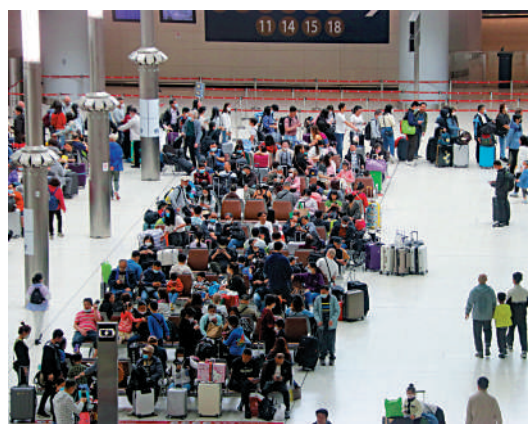
▲西九龍站內旅客人頭湧湧。

大公報記者昨日乘搭地鐵前往高鐵路西九龍站，抵達柯士甸站後，在通過西九龍站的通道，已見到更多旅客急匆匆趕往搭高鐵。早上7時30分左右，高鐵路離港大堂內，已有大批攜帶行李的乘客在排隊等候安檢，當中包括內地遊旅行團。