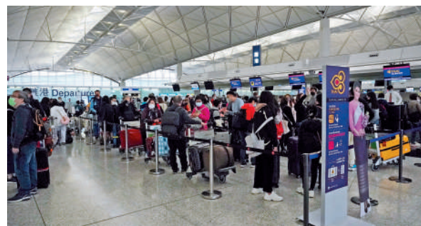
▲香港國際機場今年3月客運量超過260萬人次，3月26日單日入境旅客更達8.3萬人次。

林世雄稱，香港航空業復甦面對最大的挑戰是人手問題，政府一直與機管局及航空業界保持溝通，採取一系列措施紓緩人手壓力。機管局已完成新一輪的人力調查，政府目標在今年稍後制訂措施，推動航空業人力資源的可持續發展。