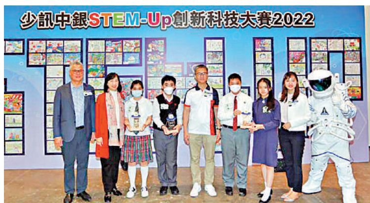
▲警務處處長蕭澤頤擔任頒獎禮主禮嘉賓，並與得獎者合照。