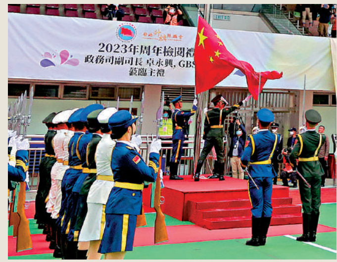
▲香港升旗隊總會昨日舉行2023年周年檢閱禮，近800人出席。