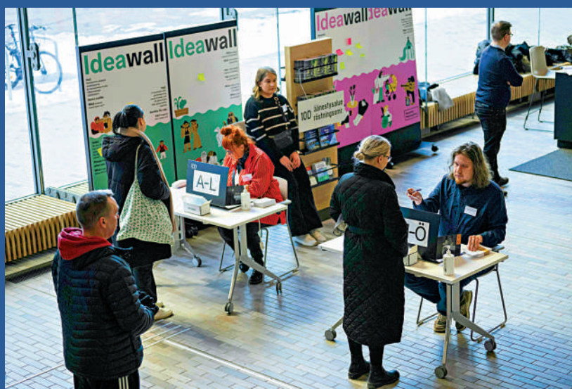
▲選民2日在赫爾辛基的投票中心排隊登記投票。法新社

【大公報訊】綜合路透社、法新社、《衛報》報道：芬蘭召開議會大選，投票於當地時間2日晚上8點（本港時間3日凌晨1點）結束，約40%選民已提前投票。選前民調顯示，芬蘭總理馬林領導的中左翼社會民主黨，與右翼的民族聯合黨、芬蘭人黨勢均力敵，預計沒有政黨可以單獨執政，需要組建聯合政府。分析指，由於兩個右翼政黨都想將馬林趕下台，再加上經濟低迷令選民不滿，芬蘭可能會歷史性地轉向右翼。