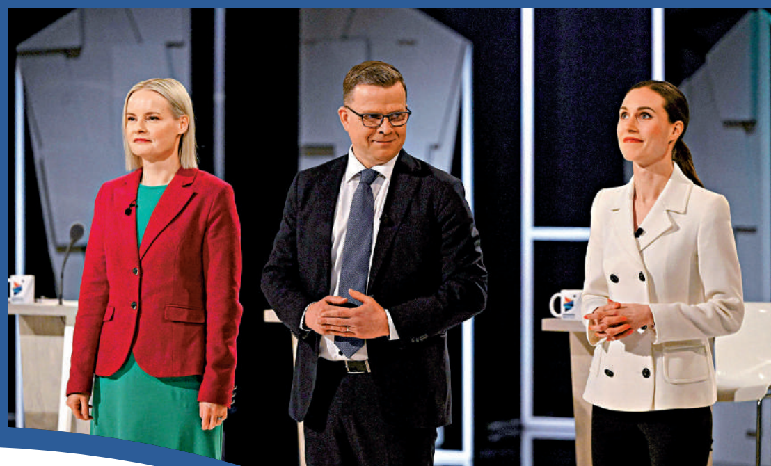
▲（左起）芬蘭人黨黨首普拉、民族聯合黨黨首奧爾波和社會民主黨黨首馬林3月30日參加選舉辯論。