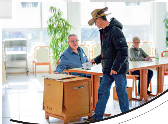
▲一名男子2日在芬蘭圖爾庫投票。