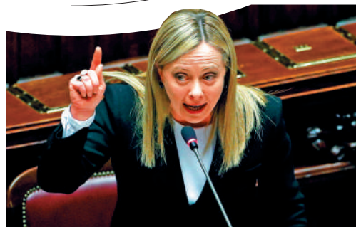
▲意大利總理梅洛尼所在政黨提出「限用英語」草案。