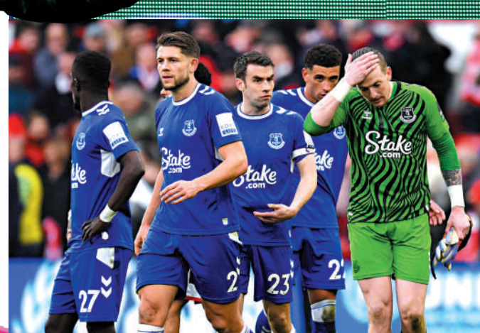
▲愛華頓防線恐難防止卡尼的進襲。