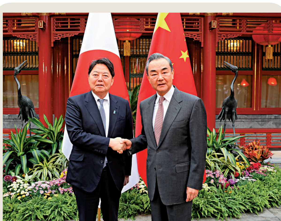
4月2日，中共中央政治局委員、中央外辦主任王毅在北京會見日本外相林芳正。