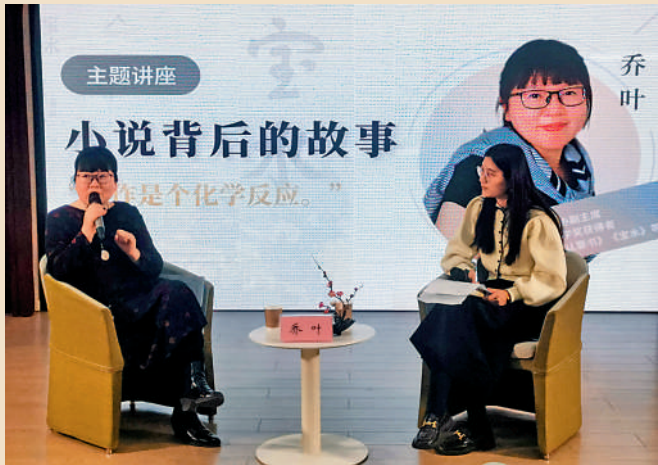
▲3月下旬，喬葉（左）在北京東城區圖書館與讀者交流。

自去年底由北京十月文藝出版社出版以來，北京作協副主席、作家喬葉的長篇小說《寶水》登上多個文學好書榜單，不僅入選北京文化精品工程重點項目，也進入中國作協「新時代文學攀登計劃」首批項目支持名單。這部小說從「冬—春」「春—夏」「夏—秋」「秋—冬」四個章節展開，如同一幅長卷將四時節序中的鄉村生活娓娓道來，在「寶水」這個既虛且實的村落裏，發散和衍生出諸多清新鮮活的新時代農村故事。