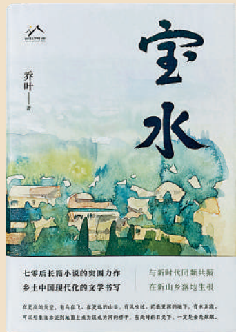
◀喬葉新作《寶水》去年11月出版以來已登上多個文學好書榜單。