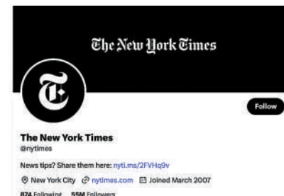
▲《紐約時報》推特主賬號失去「藍勾」標記。網絡圖片

馬斯克發推文批評《紐約時報》，說「@NYTimes真正的悲劇在於他們的宣傳一點都不有趣」，還說《紐約時報》主要新聞內容「不值一讀」，而且《紐約時報》非常積極地向讀者推銷付費訂閱，卻拒絕支付Twitter賬號認證，明顯是「雙重標準」。