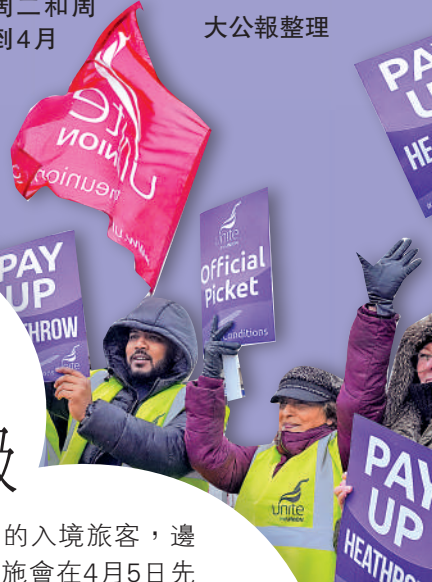
▶英國希思羅機場保安進行為期十日的罷工。