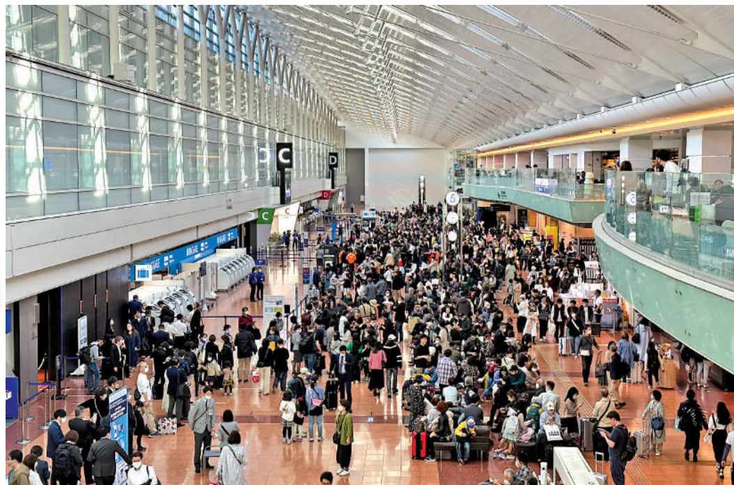
▶受全日空電腦系統故障影響，東京羽田機場內人滿為患。