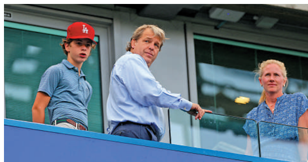
▲車路士老闆保希利 (中) 今季已開除兩名主帥。