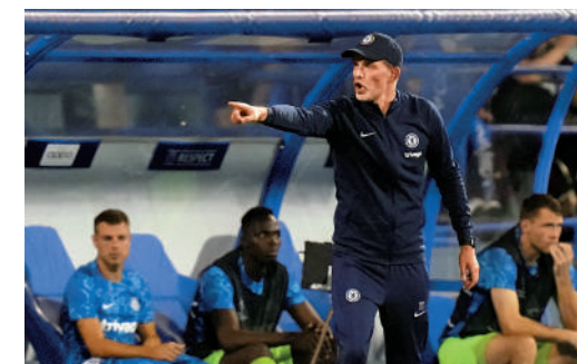
▲車路士易手後，主帥杜切爾 (前) 突然被炒。