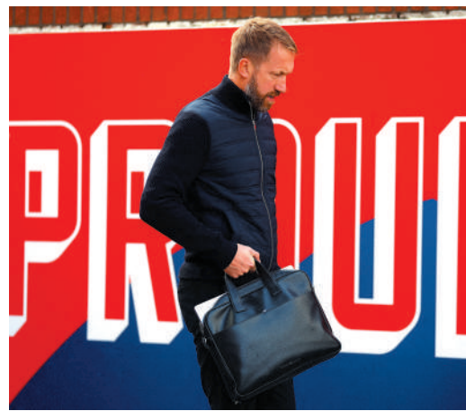
▲樸達在負維拉的英超賽事後被炒。