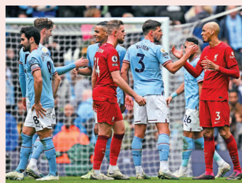
▲利物浦 (紅衫) 剛戰負曼城。資料圖片

在新人巴積迪提早休季、拿比基達一傷再傷恐已為利物浦踢完最後一仗之下，客軍中場還是無人可換，加上已變成「紅鶴馬古尼」的中堅華基爾雲迪積克，上仗對曼城時失4球，今仗就以少於4球為目標吧。