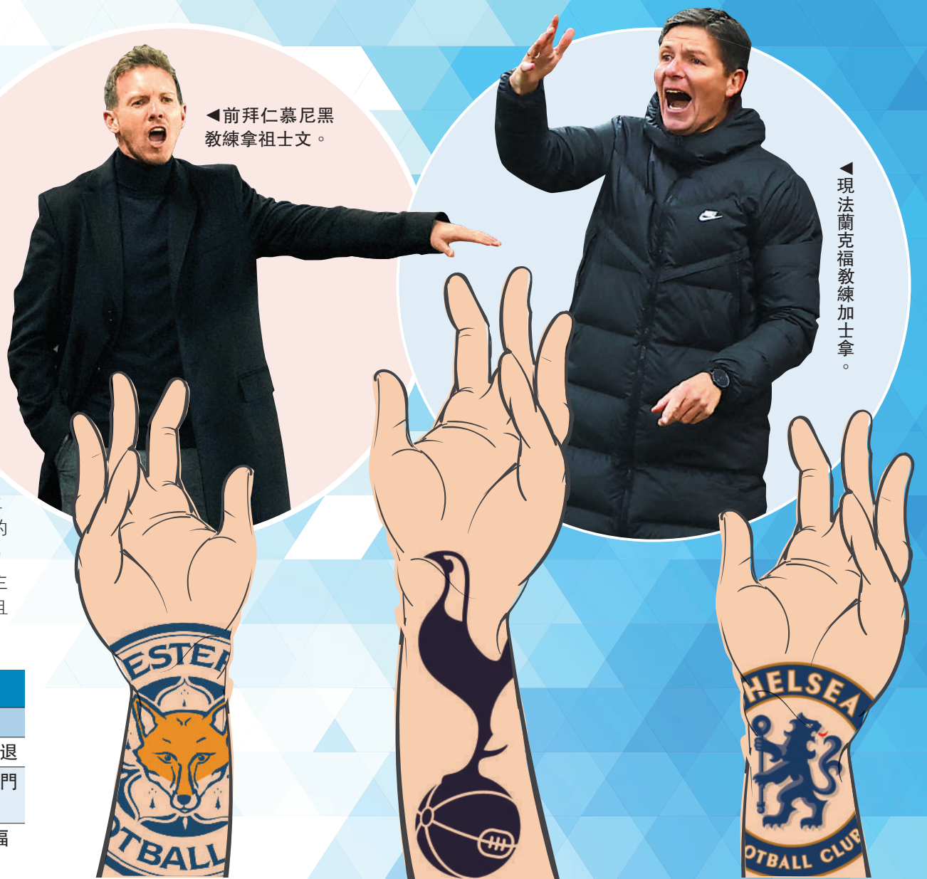
◀前拜仁慕尼黑教練拿祖士文。