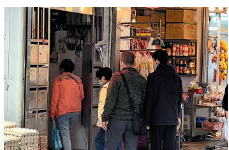
曾出現「垃圾山」的順寧道唐樓4月開始恢復收垃圾，記者所見大廈入口已沒垃圾堆積。

唐樓屬於私人地方，若出現嚴重的垃圾堆積問題，如「垃圾屋」，李詠民建議政府部門可引用《公共衛生條例》，進入大廈處理。另外，將在全港18區設立的地區關愛隊，亦可協助解決民生事務，包括處理唐樓的垃圾問題。