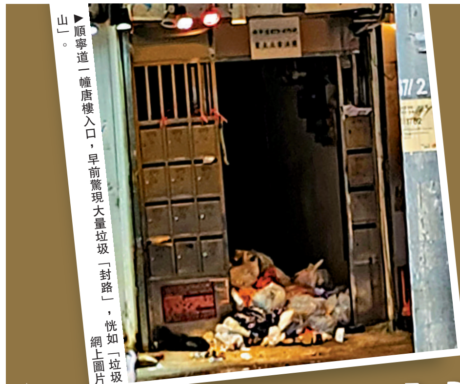
順寧道一幢唐樓入口，早前驚現大量垃圾「封路」，恍如「垃圾山」。