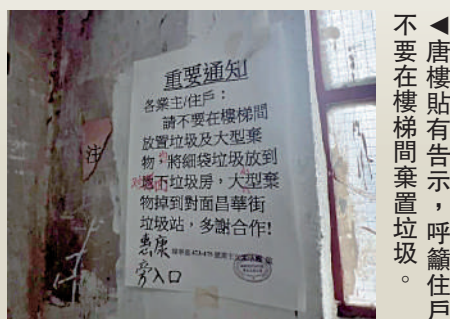
唐樓貼有告示，呼籲住戶不要在樓梯間棄置垃圾。