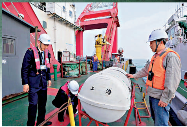
▲▲4月5日，由台灣海峽大型巡航救助船「海巡06」輪領銜的海事執法船艇編隊開啟台灣海峽中北部聯合巡航巡查專項行動。圖為福建海事局工作人員檢查過往船隻。