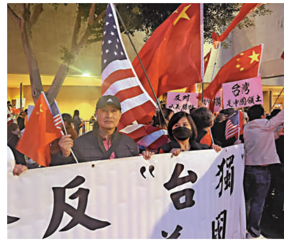
▲台灣當局領導人蔡英文4日抵達美國洛杉磯，眾多華僑華人在其下榻酒店外舉行抗議示威，堅決反對其「過境」竄美、破壞中美關係。