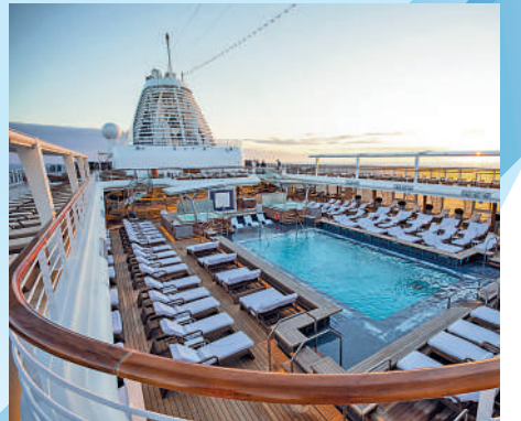
豪華旅遊復甦快，對經營者異常吸引。