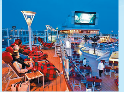
酒店殺入郵輪業，傳統郵輪企業嚴陣以待。