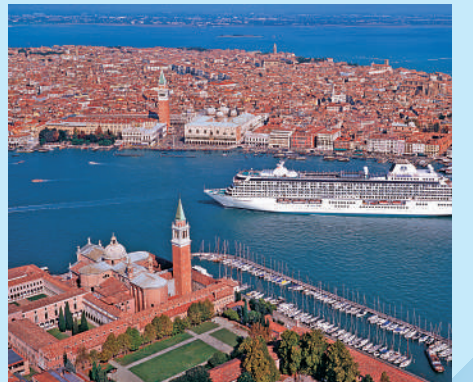
豪華郵輪旅遊需求近年大增。