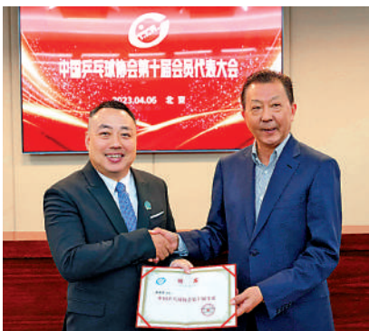
▲劉國梁（左）在國家體育總局副局長李穎川手中，接過中國乒協第10屆主席職務。

【大公報訊】據新華社報道：中國乒乓球協會第10屆會員代表大會6日在京召開。經過表決，會議選舉產生了新一屆中國乒協領導機構，劉國梁當選為中國乒協第10屆主席。