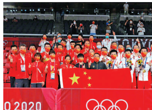
▲劉國梁帶領中國乒隊在東京奧運奪冠男女單及男女團體賽冠軍。

談及中國乒乓球隊2023年的主要任務，劉國梁表示，今年是巴黎奧運的備戰衝刺年，國乒也會在今年年底基本完成巴黎奧運參賽陣容的組建，這一年國家隊的備戰任務比較重。