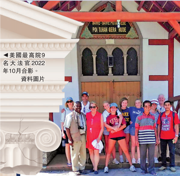
▲托馬斯夫婦（前排左一左二）和克羅（後排右一）2019年在印尼遊玩。網絡圖片

ProPublica網站6日發表調查報道指，過去二十多年，托馬斯幾乎每年夏季都會到克羅名下位於紐約州阿迪倫達克山脈的豪華度假屋住上一周。該網站通過分析社交媒體照片、採訪遊艇員工等途徑發現，托馬斯及其妻子金尼曾多次與克羅夫婦一同旅行，乘坐克羅的私人飛機和豪華遊艇前往加州、得州等地度假，還曾到國外遊玩。