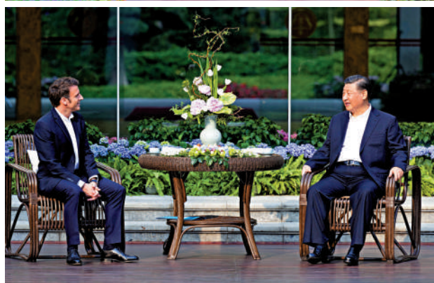
▲4月7日下午，中國國家主席習近平在廣東省廣州市松園同法國總統馬克龍舉行非正式會晤。兩國元首在庭園散步，邊走邊聊，不時駐足，饒有興致地觀賞嶺南園林的獨特景致。新華社