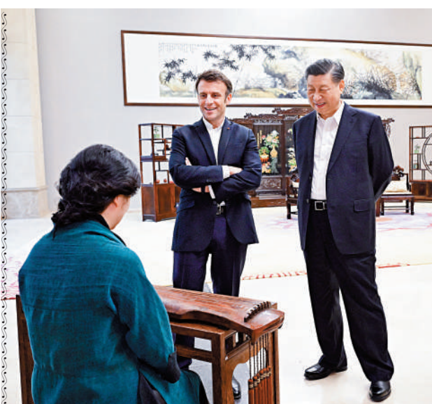
▲中法兩國元首在白雲廳欣賞古琴演奏。