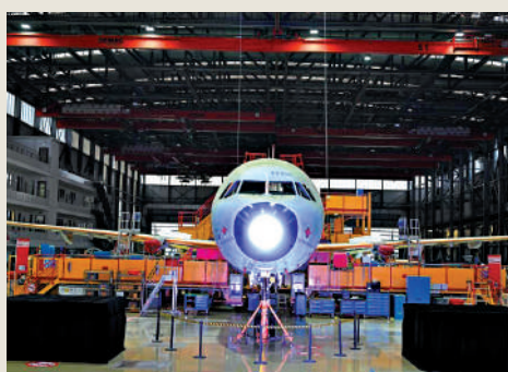
▲2022年11月9日，在空客天津總裝線，首架空客A321飛機上線開始總裝。

6日，商務部歐洲司司長余元堂在中法企業家委員會第五次會議開幕致辭中說，中法兩國元首保持密切交往，為中法經貿合作指明了方向。2022年，中歐合作克服重重不利影響，雙邊貿易額再创新高，達8473億美元；歐洲企業對中國市場信心不減，新增對華投資121億美元，大幅增長70%。