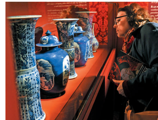
▲2014年，為慶祝中法建交50周年，法國凡爾賽宮舉辦「中國在凡爾賽」特展。

兩國元首同意盡快召開新一屆中法科技合作聯委會會議，確定雙邊科學合作和促進碳中和科技合作的「中法碳中和中心」的重大方向。希望通過中法科研夥伴交流計劃（休伯特·居里安—蔡元培合作計劃）等促進科研人員交流。