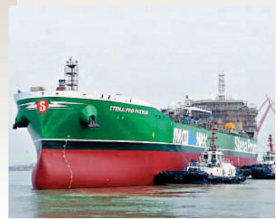
▲中國首艘甲醇雙燃料綠色船舶出塢。