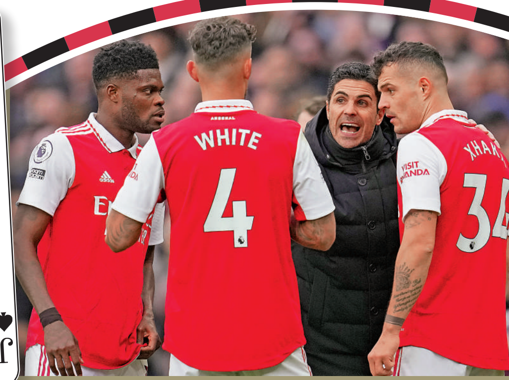
阿迪達(右二)今季助阿仙奴獲得好成績。資料圖片