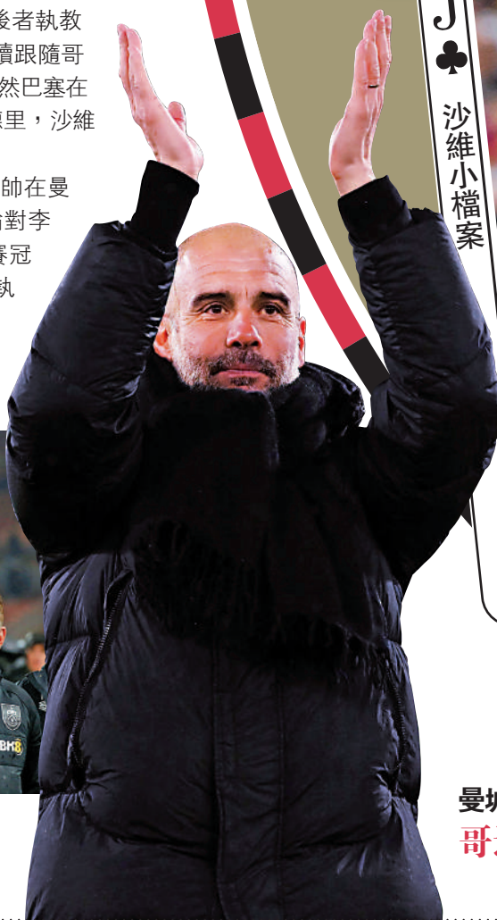
曼城主帥哥迪奧拿

球員時代位置: 中場 球員時代錦標: 8次西甲、3次西盃、6次西超盃、4次歐聯、2次歐超盃、2次世冠盃(巴塞隆拿) 執教球隊: 巴塞隆拿 執教時代錦標: 西超盃(巴塞隆拿),卡塔爾聯賽、2次卡塔爾盃