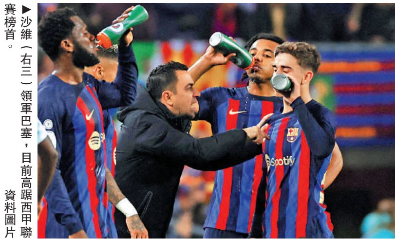
沙維(右三)領軍巴塞,目前高踞西甲聯賽榜首。