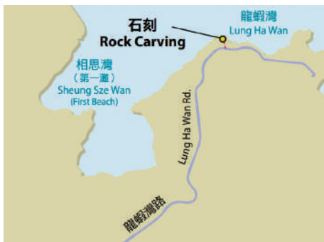
龍蝦灣石刻地理位置圖。

行完龍蝦灣郊遊徑全程，離郊遊徑終點的龍蝦灣不遠處，沿龍蝦灣路步行大約5分鐘，可發現有近3000年歷史的龍蝦灣崖邊石刻，在1978年由一群旅遊人士發現。石刻多數是刻在離海面數米至十數米高的垂直崖壁上，讓海中作業的漁民從遠處都能輕易看見。有些學者主張這些石刻是當時族群或聚族宗宗教祭祀用的旌幟符號，或是用作驅邪鎮妖的圖騰，石刻也有可能是代表族群的標記，用以告訴其他部落這是他們的領地，或是給予漁民的導航指示。龍蝦灣石刻的紋飾刻於一塊向東的