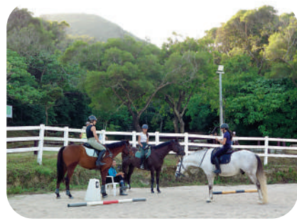
清水灣騎術學校位於龍蝦灣郊遊徑的盡頭。後方山嶺是大嶺峒。