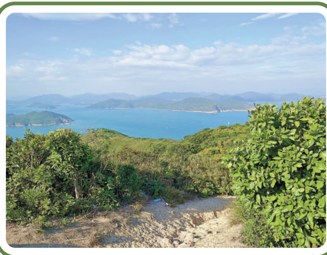
身處圓頂大嶺峒，欣賞近乎360度廣角的海景。

在此可俯瞰清水灣、布袋澳、牛尾海及西貢海的海灣風光，牛尾洲、吊鐘洲、火石洲及呈鋸齒形的果洲群島也清晰可辨；若備有遠望鏡，更可遠眺小島上由海水侵蝕而成的海蝕洞及每個小島獨特的外貌。離開觀景台，來到距觀景台十數米的平地繼續欣賞，驚喜地發現近年浮潛、划獨木舟的熱門地點「綠蛋島」(正名稱「爛排」)就在附近。小島呈半圓形，島中間有植被，酷似綠色的荷包蛋，造型很是可愛。同行友人是航拍迷，此行他也用無人機從不一樣的角記錄清水灣的美，讓我們從航拍角度了解到綠蛋島的海水有多清澈。