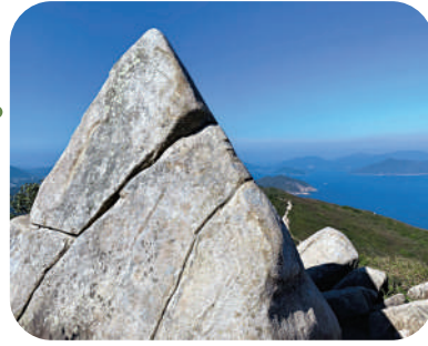
這塊大石頭特別顯眼，像三角飯糰。

下山行至龍蝦灣郊遊徑的盡頭，清水灣騎術學校及教育中心建於此，周末下午有不少外籍青少年在這裏學騎馬，繞過騎術學校，跟隨指示牌來到不遠處的龍蝦灣風箏場，此地空曠無障礙物，遊人可盡情享受放風箏的樂趣。就算不放風箏也沒關係，廣闊海景配上大草地，足以令人心曠神怡。