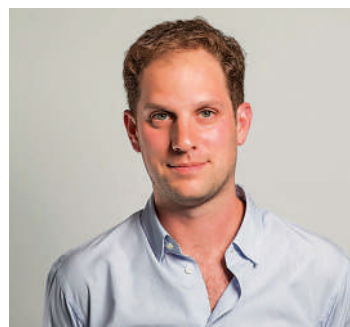
◀《華爾街日報》記者埃文·格什科維奇在俄羅斯從事間諜活動。

格什科維奇出生於蘇聯移民家庭，他在美國新澤西州長大，能說一口流利的俄語。2017年底，格什科維奇搬到莫斯科，加入英語版《莫斯科時報》，後就職於法新社。俄羅斯於2022年2月宣布對烏開展特別軍事行動，當時住在倫敦的格什科維奇隨即返回俄羅斯，加入《華爾街日報》莫斯科分社，經常前往俄羅斯進行新聞報道。