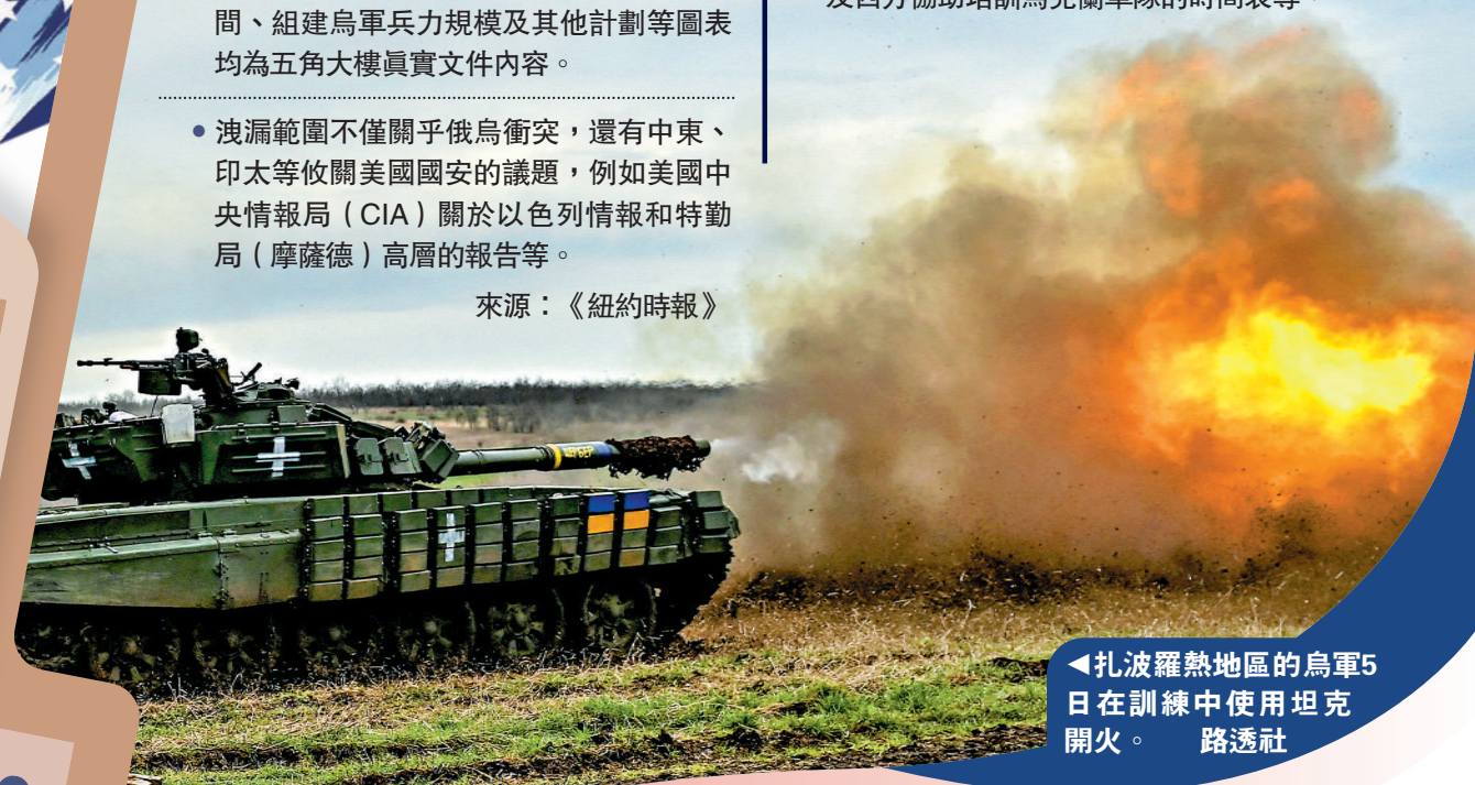
◀扎波羅熱地區的烏軍5日在訓練中使用坦克開火。

• 文件包含概述烏克蘭防空系統的位置和運作細節，例如每種防空導彈數量，烏軍何時會耗盡哪種彈藥的預測，美國與盟國偵察機於黑海執行任務的班表與路線，援烏美製武器的一些弱點，以及西方協助培訓烏克蘭軍隊的時間表等。