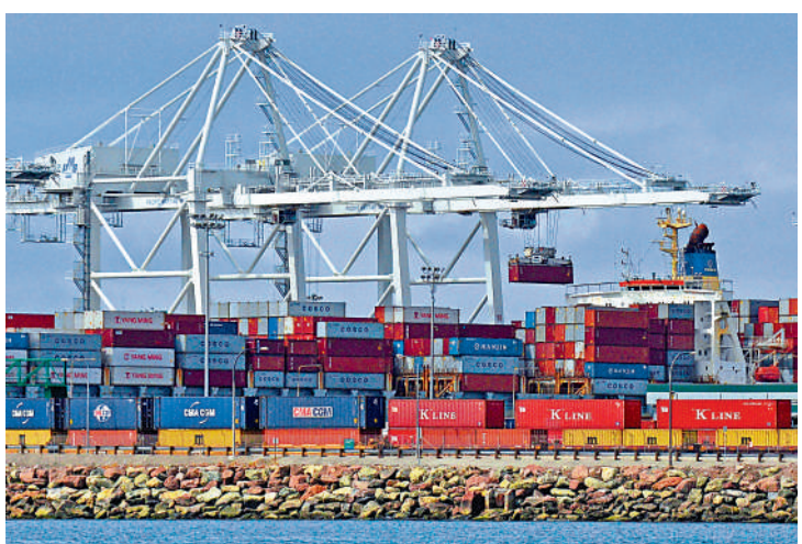
▶加州洛杉磯港、長灘港恐積壓大量貨物，圖為長灘港碼頭。

位於加州南部聖佩德羅灣的洛杉磯港和長灘港，貨櫃吞吐量共佔全美40%左右，年貨櫃吞吐量近2000萬個標箱，價值超過3000億美元。