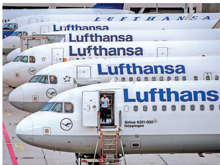
▶德國漢莎航空於2022年恢復盈利。