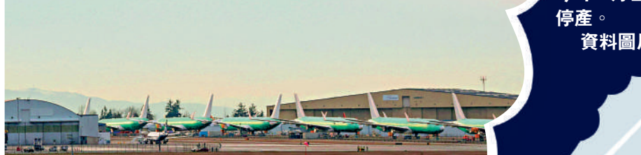
◀波音747客機於今年1月正式停產。資料圖片