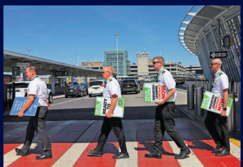
▲美國機師人手短缺，圖為紐約機師去年罷工要求簽新合同。

美國政府估計，在10年內，每年將有約1.8萬個機師的職位空缺，其中大部分是年滿65歲的機師退休後空出來的。未來數年，航空公司都將處於招聘狂潮中。然而，自2017年至2021年，美國聯邦航空管理局平均每年頒發不到1萬份新機師執照。奧緯諮詢公司估計，北美的航空公司到2032年將面臨近3萬名機師的短缺。新機師人數會不斷增多，但趕不上退休潮。