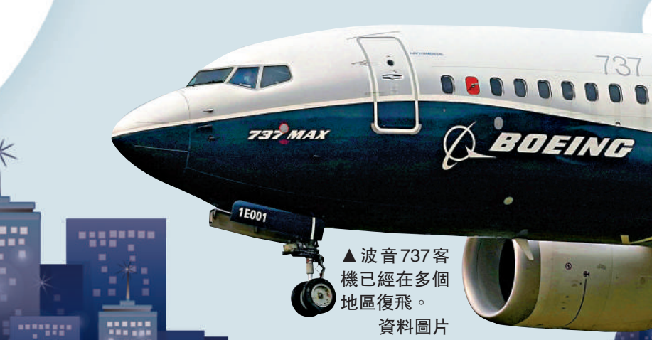
▲波音737客機已經在多個地區復飛。

那麼未來會怎樣呢？英國克蘭菲爾德大學航空運輸管理高級講師桑切斯認為，由於航空公司需要復甦資金、燃油價格上漲以及航空業投資於可持續技術，票價將在「幾年內」持續上漲25%。而全球飛行網站FlightGlobal的戰略內容主管莫里森則認為，目前高價與需求恢復快於供應有關，未來價格可能下調。