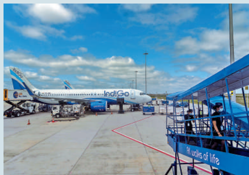
◀印度靛藍航空表示飛機延誤交付拖慢公司發展速度。

與此同時，由於波音無法按時交付787夢想客機，美國航空集團當地時間3月24日表示，將在5月和6月初停飛費城至馬德里航線幾周時間。2022年，在波音公司處理各種製造和監管問題時，夢想客機被強制暫停交付，當時美國航空也縮減了夏季飛行計劃。