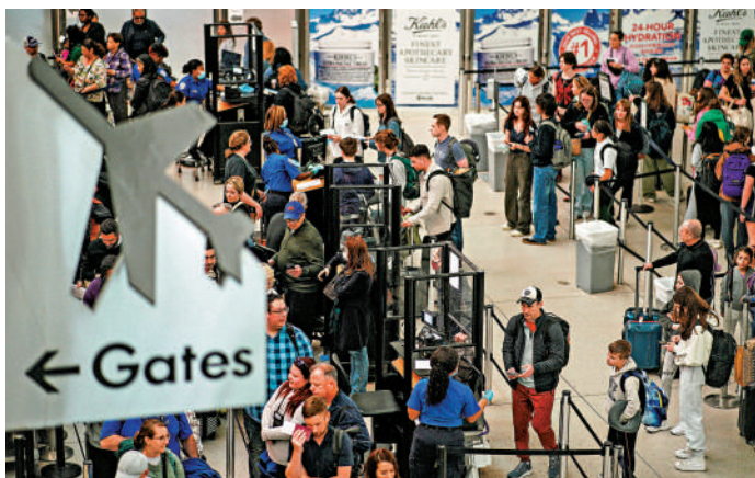
▲旅業復甦，商業航班機位需求增多，圖為旅客4月6日在紐約肯尼迪機場排隊等候。

【大公報訊】綜合CNN、法新社及彭博社報道：過去的三年內，全球航空業飽受新冠疫情衝擊，自2020年以來至少有64家航空公司倒閉。隨着全球旅遊業逐漸復甦，各大航空公司又面臨新的機遇和挑戰，從機師到機場地勤都存在人手不足的問題。與此同時，商業航班的供需平衡也出現轉變，因為可觀的利潤，各大航空公司不急於短期內恢復運力，旅客們勢必面臨越來越貴的機票價格。