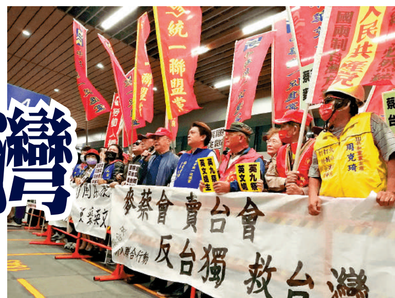
▲蔡英文4月7日晚返台，統派團體組織近300人前往桃園機場進行抗議，批判所謂「麥蔡會」是「賣台會」。

【大公報訊】據新華社報道：中國台灣地區領導人蔡英文6日以「過境」為名竄美並與美眾議議長麥卡錫見面，7日晚返回台灣。當晚，島內數十個政黨和團體在桃園機場舉行反「台獨」反介入聯合行動，高呼「麥蔡會，賣台會」「倚美謀獨，掏空台灣」等口號，強烈譴責民進黨當局為配合美國政客用以消耗大陸的「毀台計劃」，推動台美勾連、「倚美謀獨」的這一新的挑釁行徑，為謀一黨政治私利而禍害台灣。