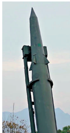
►火箭軍多個常規導彈旅對預定目標實施模擬打擊，檢驗聯合作戰體系支撐下火力快反和遠程精打效能。