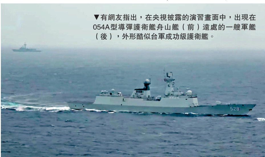
▼有網友指出，在央視披露的演習畫面中，出現在054A型導彈護衛艦舟山艦（前）遠處的一艘軍艦（後），外形酷似台軍成功級護衛艦。

●這是一次多軍兵種聯合行動，東部戰區陸軍遠箱火、海軍驅護艦、導彈快艇、空軍殲擊、轟炸、干擾、加油等機型，火箭軍常導火力單元等各軍兵種之間的配合展示得淋漓盡致，展示解放軍聯合作戰能力。