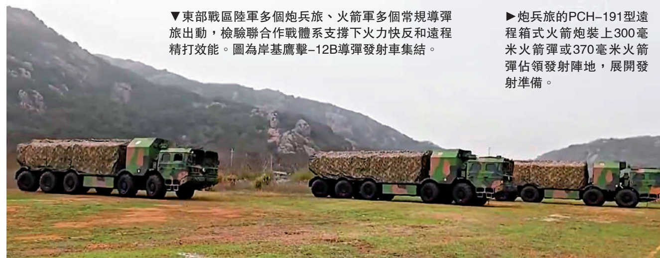
▼東部戰區陸軍多個炮兵旅、火箭軍多個常規導彈旅出動，檢驗聯合作戰體系支撐下火力快反和遠程精打效能。圖為岸基鷹擊-12B導彈發射車集結。