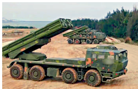
►炮兵旅的PCH-191型遠程箱式火箭炮裝上300毫米火箭彈或370毫米火箭彈佔領發射陣地，展開發射準備。