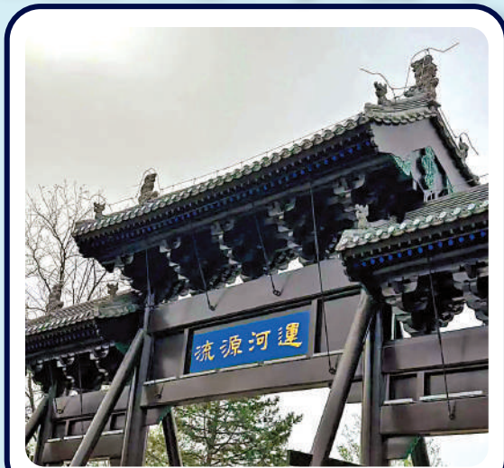
▲大運河源頭遺址公園內，遊人在白浮泉碑亭觀光。