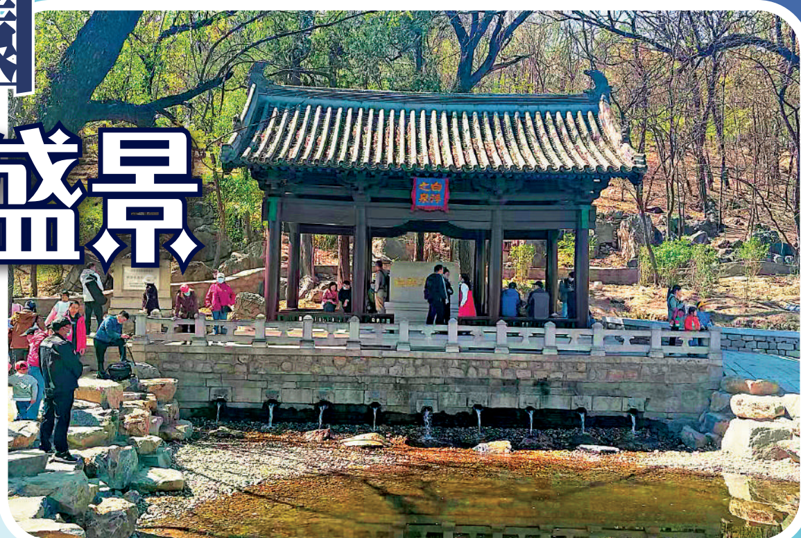
▲大運河源頭遺址公園內，遊人在白浮泉碑亭觀光。