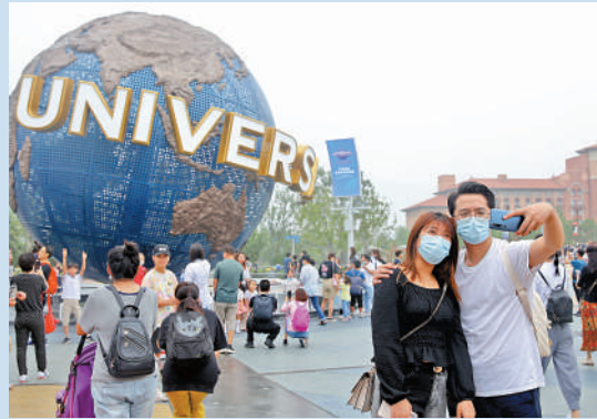
▲遊客在北京環球度假區的標誌性景觀前拍照留影。