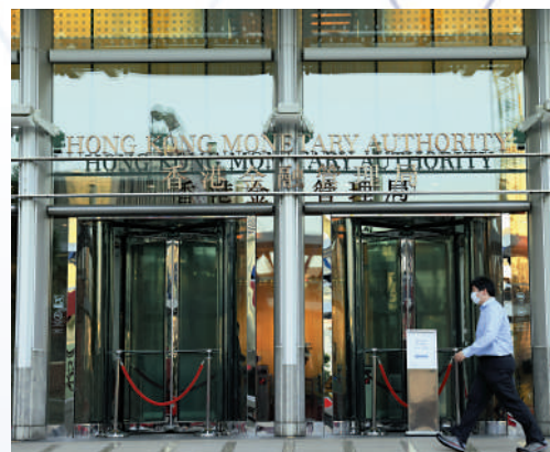
▲港美息差仍然闊，市場相信金管局有機會入市承接港元沽盤。