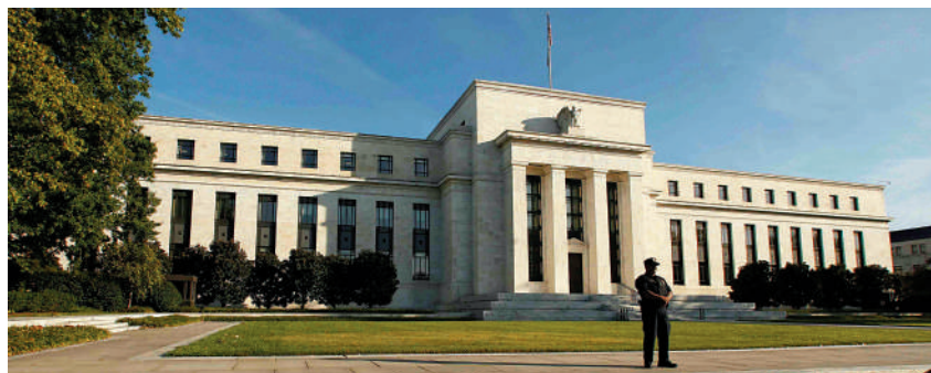
▲美國自去年3月開始進入加息周期，有望於下月結束。

高盛指出，每一基點淨息差的變化對銀行每股盈利（EPS）約有0.8%至0.9%影響，故此市場對利率走勢的預期，意味2023年至2025年每股盈利有15%至20%的下行風險。