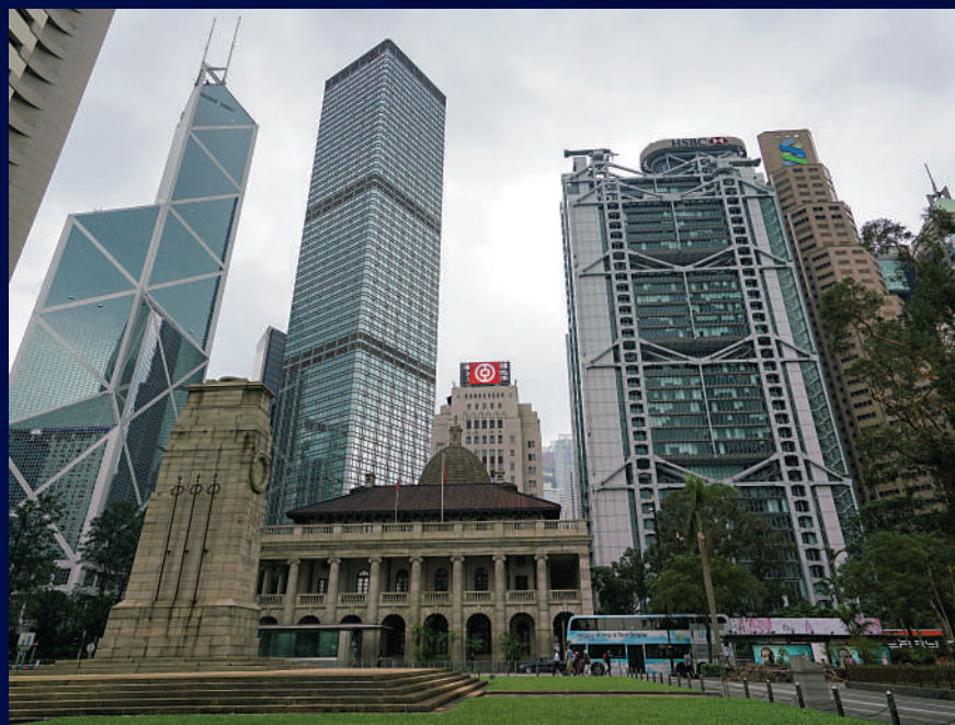
▲隨着香港經濟逐步復甦，本港銀行非利息收入亦料會改善。