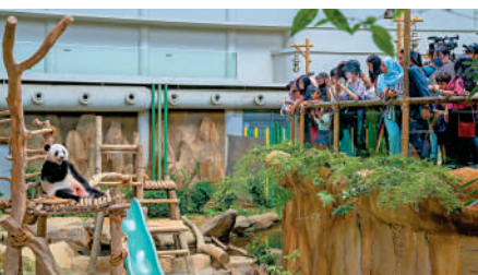
3月11日，遊客在馬來西亞吉隆坡觀看大熊貓。