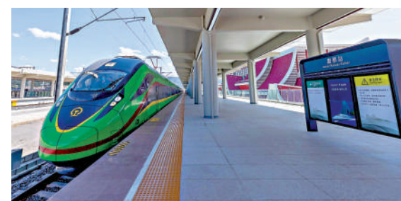
中老鐵路國際旅客列車將於13日首發。

線上線下同時發售國際旅客列車車票。跨境旅客進出站、口岸通關上下車時，均須核驗紙質車票。