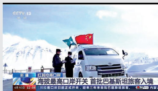
紅其拉甫口岸海拔最高口岸開關 首批巴基斯坦旅客入境

本屆消博會展覽總面積達12萬平方米。共有來自65個國家和地區的超過3300個消費精品品牌參展，預計各類採購商和專業觀眾將超過5萬人。