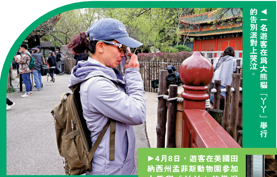
一名遊客在為大熊貓「丫丫」舉行的告別派對上哭泣。

同時，除了回國安享晚年的大熊貓外，適齡的大熊貓在適應國內的生活後，都要在家鄉找到心儀的對象，並完成繁育下一代的任務。根據資料顯示，一般旅居海外的大熊貓多數在回國的第三年才會誕生下一代。