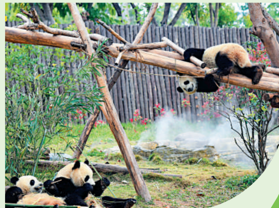
成都大熊貓繁育研究基地內的大熊貓與同伴玩耍。

供的食物種類、數量、質量都符合大熊貓飼養管理標準。對於網友們反映的大熊貓乞食行為，中國大熊貓保護研究中心表示，這實際是大熊貓對飼養員的期待。在人工圈養條件下，大熊貓與飼養員長期相處，建立了良好的互動和信任關係，當飼養員呼喚或前來的時候，就會有所反應，這也是大熊貓身體健康的一種體現。