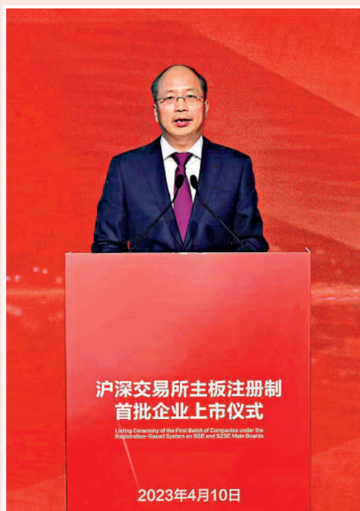
▲中國證監會黨委書記、主席易會滿表示，註冊制改革帶來的變化是全方位及根本性的。