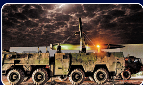
▶參演火箭軍某部在進行轉戰導彈訓練。

實戰準備漸趨深入 此次「聯合利劍」演習沒有設置實際使用武器科目，從此前「火力圍島」發展到此次演習中「兵力圍島、火力模擬上島」，解放軍對台實戰準備漸趨深入。