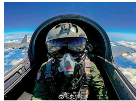
▶參演戰機在進行空中機動。