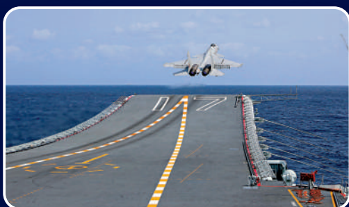
◀殲-15艦載機從海軍山東艦起飛升空。

實戰準備漸趨深入 此次「聯合利劍」演習沒有設置實際使用武器科目，從此前「火力圍島」發展到此次演習中「兵力圍島、火力模擬上島」，解放軍對台實戰準備漸趨深入。