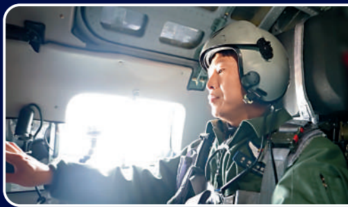
▶參演戰機在進行空中機動。

模擬「圍殲」台軍艦艇 此次軍事行動中實施了模擬「圍殲」台軍海上艦艇。東部戰區陸上、海上和空中反艦打擊群對台軍海上目標實施了全向飽和式模擬攻擊。