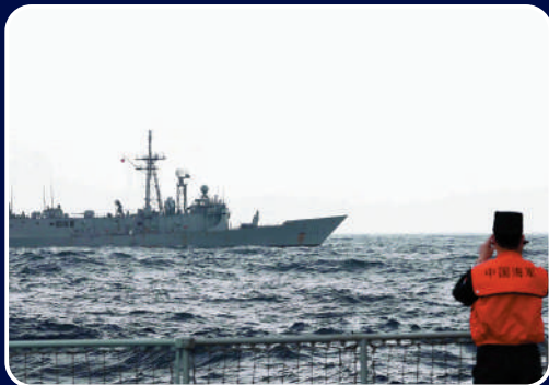
◀與台「宜陽艦」目視距離5海里，持續環台島戰巡進逼。

精準打擊關鍵目標 多軍兵種部隊在東部戰區聯合作戰指揮中心的統一指揮下對台島及周邊海域關鍵目標實施模擬聯合精確打擊。