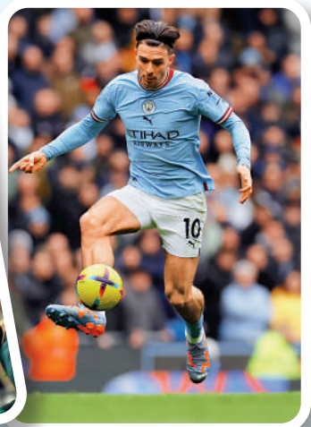
▲曼城翼鋒基亞利殊。