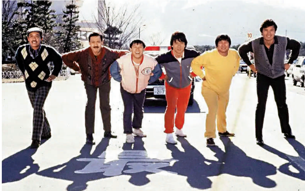
▲1985年，吳耀漢（左起）、馮淬帆、曾志偉、成龍、洪金寶和秦祥林主演電影《福星高照》。

2019年1月，吳耀漢出席電影《如珠如寶》首映禮受訪時透露自己因患腎衰竭，不久前入院做手術植入喉管，方便洗肚（腹膜透析）清走毒