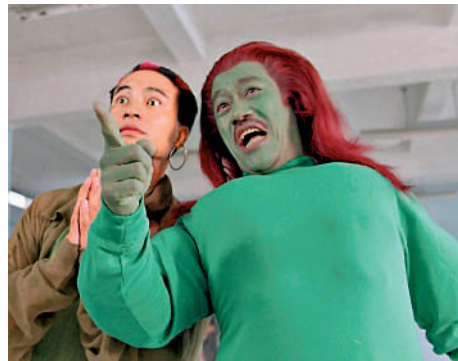
▲1983年，吳耀漢（右）參演喜劇動作片《超級學校霸王》。

吳耀漢有兩段婚姻，他曾於21歲與一名英國女子結婚，僅半年後便離婚；1965年他與現任