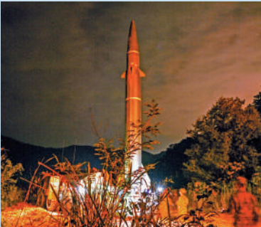
▲參加軍演的火箭軍某部在起豎導彈。

演練過程：東部戰區多軍兵種部隊對台島及周邊海域關鍵目標，實施模擬聯合精確打擊，持續保持圍島進逼態勢。