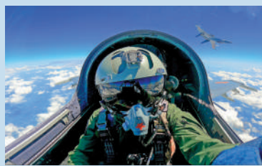
▲東部戰區戰機在進行空中機動。

演練過程：東部戰區陸軍遠箱火，海軍驅護艦、岸導突擊群，空軍殲擊、轟炸、干擾、加油等機型，火箭軍常導火力單元等任務兵力快速向預定區域機動集結，展開作戰部署。