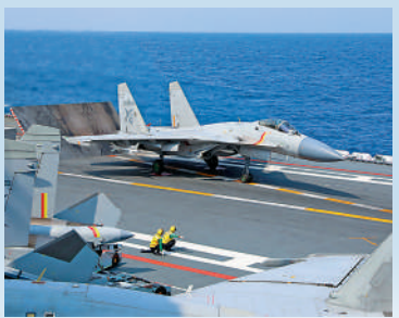
▲殲-15艦載機準備從海軍山東艦起飛。

演練過程：東部戰區空軍出動數十架殲擊機，持續位台灣海峽與台島南北兩端戰巡進逼。火箭軍部隊對海上移動目標進行火力追瞄，實施大彈量、多波次模擬火力打擊。海軍多艘驅護艦在台灣海峽，台島西北、西南以及台島以東海域主動出擊，高速進逼懾壓對手。