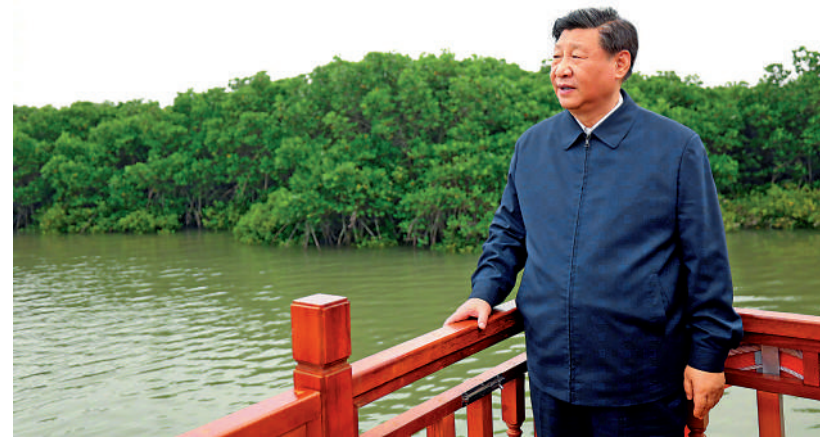
▲4月10日，習近平在湛江市麻章區湖光鎮金牛島紅樹林片區考察。