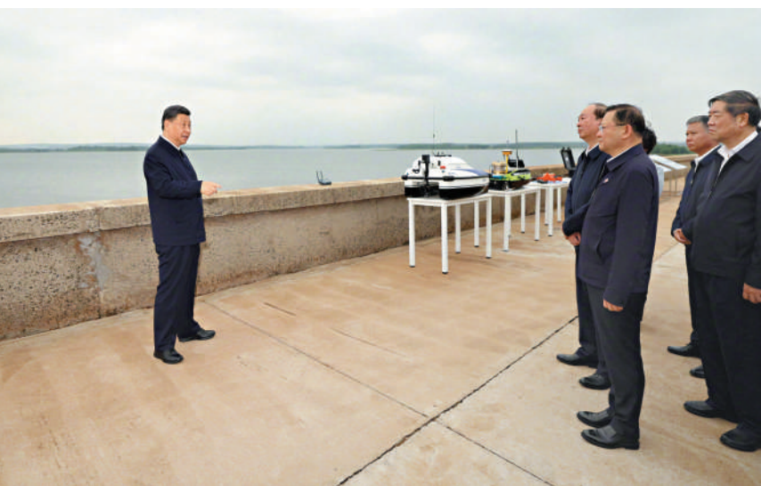
▲4月10日，習近平在湛江市環北部灣廣東水資源配置工程考察。

環北部灣廣東水資源配置工程從西江幹流取水，通過泵站加壓提水，穿過雲開大山，聯通10座水庫，調水至雷州半島，輸水線路近500公里，供水範圍包括雲浮、茂名、陽江、湛江四市，覆蓋人口超過1800萬人。工程於去年8月開工建設，總投資超600億元。這次在大水橋水庫考察，總書記重點了解當地優化水資源配置等情況。