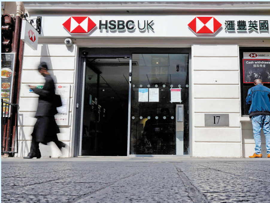
▲除了關閉英國分行外，滙豐亦計劃在當地裁員逾百人。

不過，巴克萊銀行目前有約200個臨時站點，該行計劃再增加70個，加上10個半永久性的移動站點「銀行膠囊」，可以根據需求在城鎮之間移動，用以彌補分行關閉後的服務。巴克萊又透露，將通過提供無需購買服務的現金回饋，24小時存款自動取款機，以及與郵局和Cash Access UK合作，讓客戶提取現金。