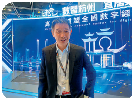
▲杭州城市大腦的總架構師、中國工程院院士王堅。

在這次的展會上，記者也看到了杭州城市大腦的總架構師——中國工程院院士王堅，他破天荒地穿着西裝來到了