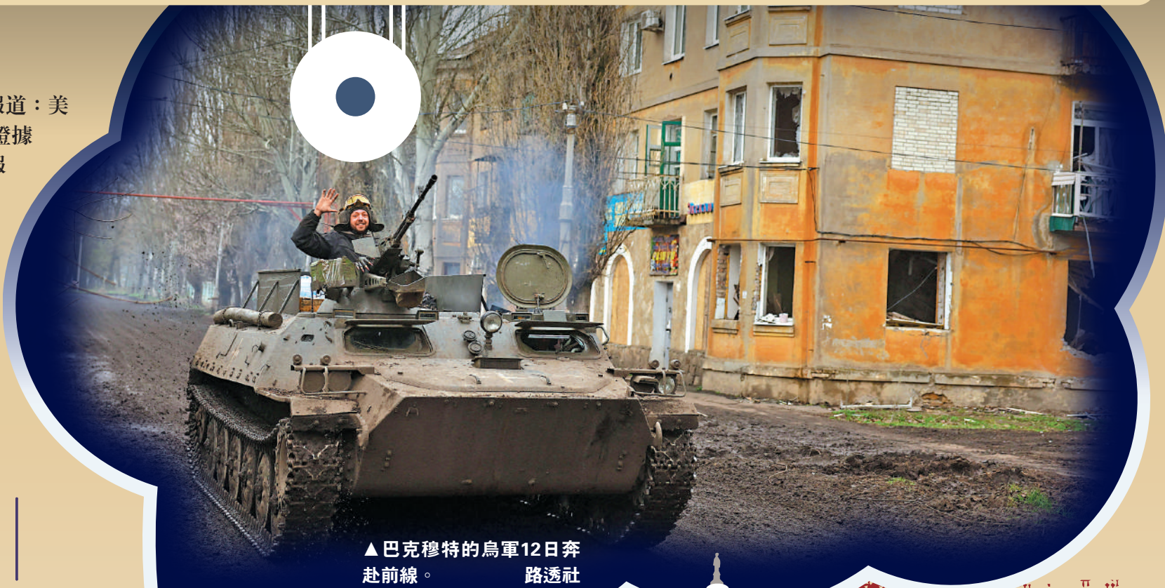
▲巴克穆特的烏軍12日奔赴前線。

據悉，OG整個冬季都在不斷分享密件，所有成員都遵守規則，沒人討論要向外傳播文件。但其中一名成員卻在3月1日將文件發布到另一個Discord群組「WowMao」上，自此迅速在網上傳播。4月6日，《紐約時報》報道洩密事件，據群組成員說，OG得知後非常慌張，告誡他們「保持低調並刪除任何可能與他有關的信息」。