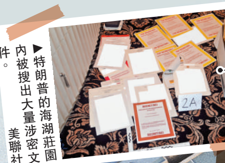
內被搜出大量涉密文件。

件，稱不擔心事件，並強調洩密未造成嚴重後果。五角大樓發言人萊德13日表示，這起事件是「蓄意的犯罪行為」，違反了國防部的保密規定。但出於國家安全、保護人員以及盟友安全的需要，美方不會討論或確認洩露機密信息的真實性。