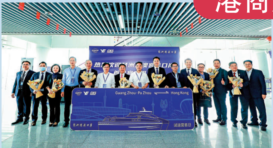
▲14日，琶洲港澳客運口岸試航，首批「飲頭啖湯」的香港旅客獲贈鮮花並合照留影。