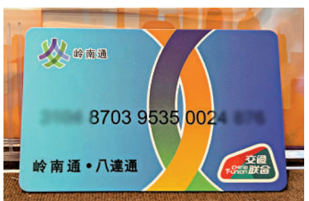
▲「嶺南通·八達通」全國交通一卡通聯名卡發布。

據介紹，卡片採用「單芯片雙電子錢包」模式，內設有2個獨立的電子錢包，一個是全國交通一卡通互聯互通。