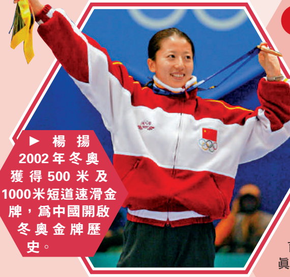
楊揚2002年冬奧獲得500米及1000米短道速滑金牌，為中國開啟冬奧金牌歷史。

1 個人強大影響力 無論是綜合性國際體育組織還是單項國際體育組織，能在決策層任職一大前提，是個人在世界體壇擁有影響力。近些年，楊揚、張虹、劉國梁等中國奧運冠軍紛紛進入國際體育組織決策層，就是他們在當運動員時取得過突出成績；更何況，短道速滑、速度滑冰、乒乓球等項目也是中國優勢項目。因此，這些進入決策層工作的中國體育人，只要中國隊在一個項目上成績越好，就很有可能有多人進入該單項國際體育組織任職。