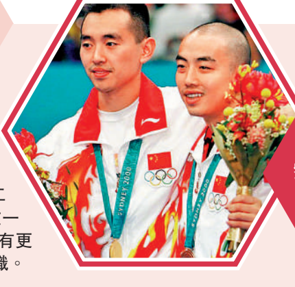
於2020年當選世界乒聯理事會主席的劉國梁(右)，為中國贏得1996年奧運男單及男雙金牌。

進入新世紀以來，中國體育軍團在歷屆夏奧會上都位列獎牌榜前三位，並成功舉辦2008年北京夏奧會和2022年北京冬奧會，谷愛凌等新銳在冬奧締造歷史性佳績，中國成為名副其實的體育大國。然而，從體育大國向真正的體育強國轉變，除了舉辦各類世界體育大賽外，國際體育組織中的話語權也是邁向體育強國的重要標誌。換言之，在中國競技體育成績躋身世界頂尖水平後，掌握體育組織的話語權將成為中國體育下一步努力的方向。中國人進入國際體育組織決策層，不僅是為了表達中國體育人的訴求，捍衛中國體育的利益，更為了能夠參與國際體育事務，推動世界體育發展，在競技體育之外的更高平台上提升中國體育的影響力。