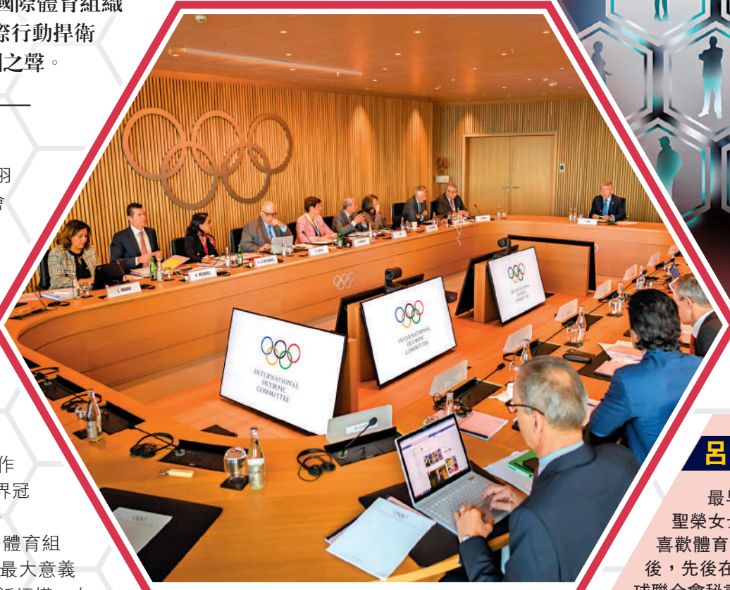
國際奧委會權力，包括選擇賽事舉辦地、制定與修改規則等。資料圖片

3 換位思考接軌國際 中國體育人需要能夠站在體育全球發展的角度來思考問題，而不是局限於制定偏向中國體育利益的政策。當中，就需要他們熟悉中西體育文化，了解不同國家體育發展模式，思考體育與教育、體育與經濟發展深度融合的方式。因此，對於剛剛退役的中國奧運冠軍、世界冠軍而言，在進入國際體育組織工作前不僅要學好外語，還需要學習西方體育文化以及體育管理、體育外交等領域的相關知識，為更好地在國際組織服務打好基礎。