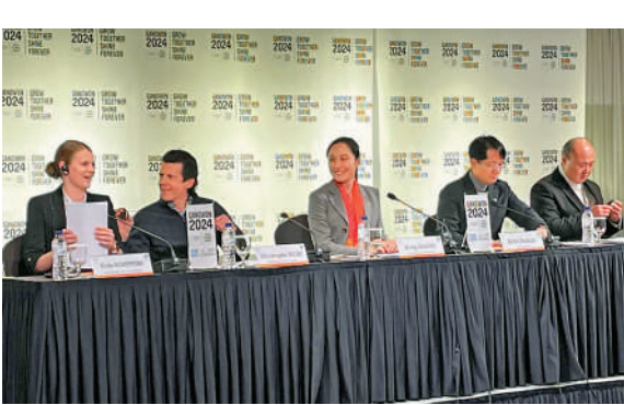
張虹(中)去年11月出席2024年江原青少年冬奧會的協調委員會會議。