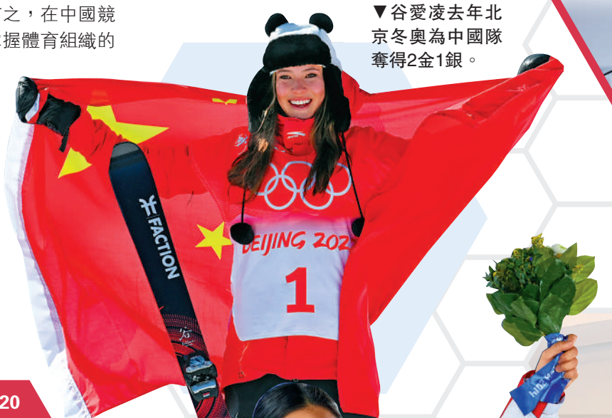
谷愛凌去年北京冬奧為中國隊奪得2金1銀。