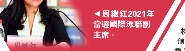
周繼紅2021年當選國際泳聯副主席。

2021年6月，中國第一位跳水奧運冠軍、中國跳水隊領隊周繼紅當選國際泳聯副主席，成為國際泳聯歷史上首位女性副主席。游泳是世界體育的主流項目，而國際泳聯也是國際體育組織中極具影響力的單項體育組織。周繼紅之所以能夠出任國際泳聯副主席，主要還是得益於她在世界跳水界的影響力。從1997年擔任國際泳聯運動員委員會委員後，她先後擔任國際泳聯跳水技術委員會委員、跳水技術委員會副主席、運動員委員會主席、國際泳聯執委等職，再加之中國跳水隊在世界跳水領域的優勢，周繼紅擔任國際泳聯副主席也實在是順理成章。