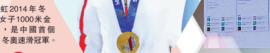
張虹2014年冬奧奪女子1000米金牌，是中國首個冬奧速滑冠軍。