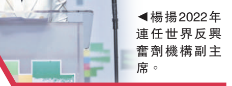
楊揚2022年連任世界反興奮劑機構副主席。

2022年11月18日，中國冬奧會首枚金牌得主楊揚成功連任世界反興奮劑機構副主席。世界反興奮劑機構是國際奧委會下設的一個重要的獨立部門，其主要任務是負責審定和調整違禁藥物的名單，確定藥檢實驗室，以及從事反興奮劑的研究、教育和預防工作。楊揚退役後，曾擔任國際滑聯運動員委員會委員、國際滑聯理事、世界反興奮劑機構運動委員會委員、國際奧委會委員等職務。2020年，她當選世界反興奮劑機構副主席，成為首位進入世界反興奮劑機構最高領導層的中國人。