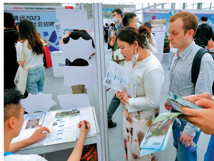
▲中國國際人才交流大會匯聚全球創新和人才資源。 中通社