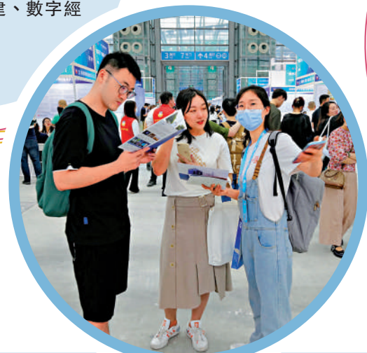
▲大會現場，來自英國、日本、俄羅斯的留學生一起交流。