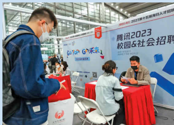
▲名企招聘展台吸引應聘者排長隊。