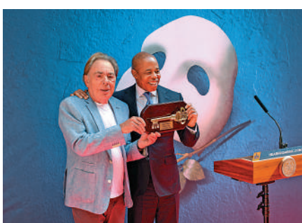
▲美國紐約市市長亞當斯14日向《歌聲魅影》作曲家韋伯（左）頒發紐約市鑰匙。

《歌聲魅影》改編自法國小說家勒胡的愛情驚悚小說，並由英國著名音樂劇大師韋伯作曲，是百老匯最長壽的音樂劇目之一。該劇講述了一位戴着面具遮掩醜陋面貌的音樂天才「魅影」，徘徊在巴黎歌劇院，訓練心愛的女高音克莉絲汀的故事，但這段愛情最後演變成了三角戀。該劇於1988年1月26日首演，隨即一炮而紅，35年來共計演出近1.4萬場。