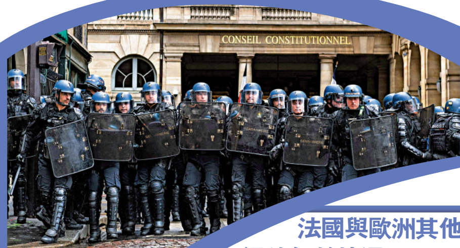
▲法國防暴警察13日在憲法委員會外戒備。