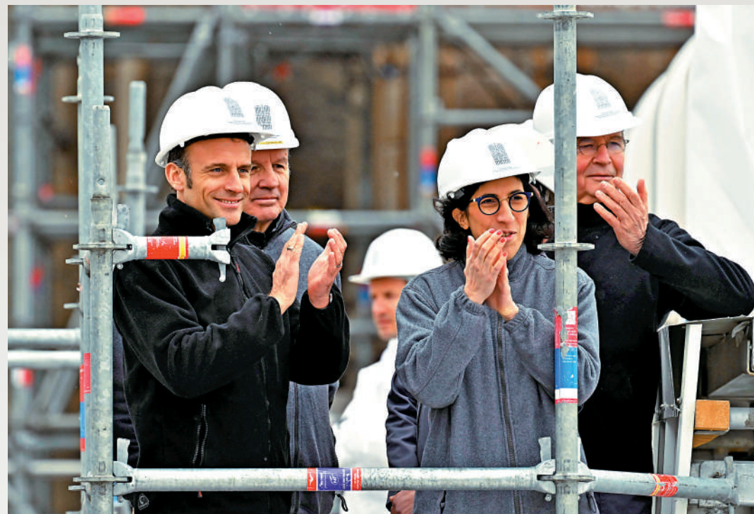
法國總統馬克龍（左）14日視察巴黎聖母院大教堂施工現場。

在過去的30年裏，法國幾乎每一次新的養老金制度改革，都會引發罷工和大規模的示威活動。據民調顯示，68%的法國民眾反對此次改革，更不滿政府不經國民議會最終表決即推動通過法案。有分析指，馬克龍政府推進法案着眼於未來，但法案引發民怨，可能進一步推動極右派民粹主義崛起。法國工會號召在5月1日國際勞動節再舉行示威。