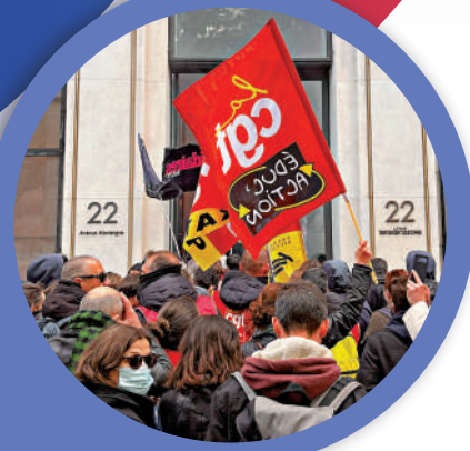
巴黎示威者13日包圍LVMH在香榭麗舍大街的總部。