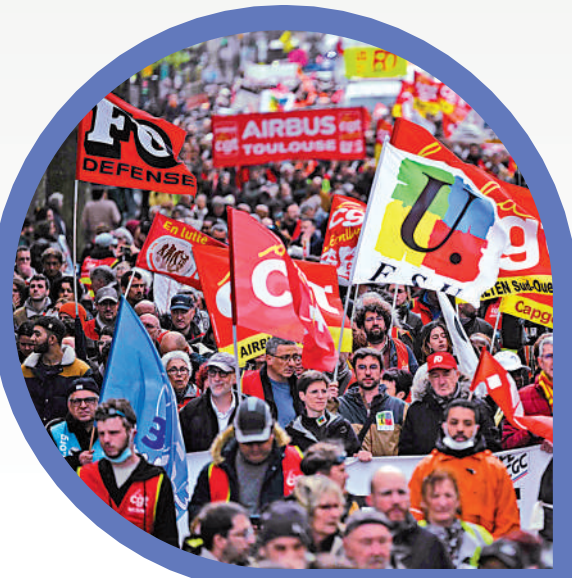
法國圖盧茲民眾14日抗議退休改革法案。法新社