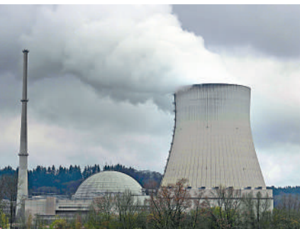
▲德國15日關閉最後三座核電站，圖為德國南部的伊薩爾核電站。

2011年，日本福島核災發生後，德國當時的默克爾政府決定關閉德國8座正在發電的核電站反應堆，並決定在2022年前分批關閉另外9座核電站，實現全面放棄核能。不過，俄烏衝突引發的能源危機導致德國的天然氣價格和電價上漲，促使德國改變原先制定的能源計劃。不僅重啟了燃煤電廠，還批准延長3座核電站的運營時長至今年4月。