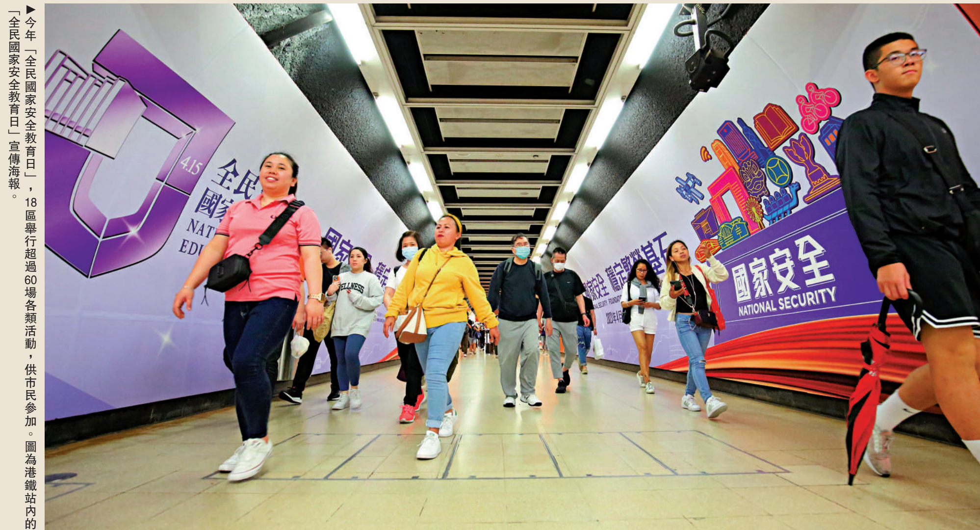
▲「全民國家安全教育日」，18區舉行超過60場各類活動，供市民參加。圖為港鐵站內的「全民國家安全教育日」宣傳海報。