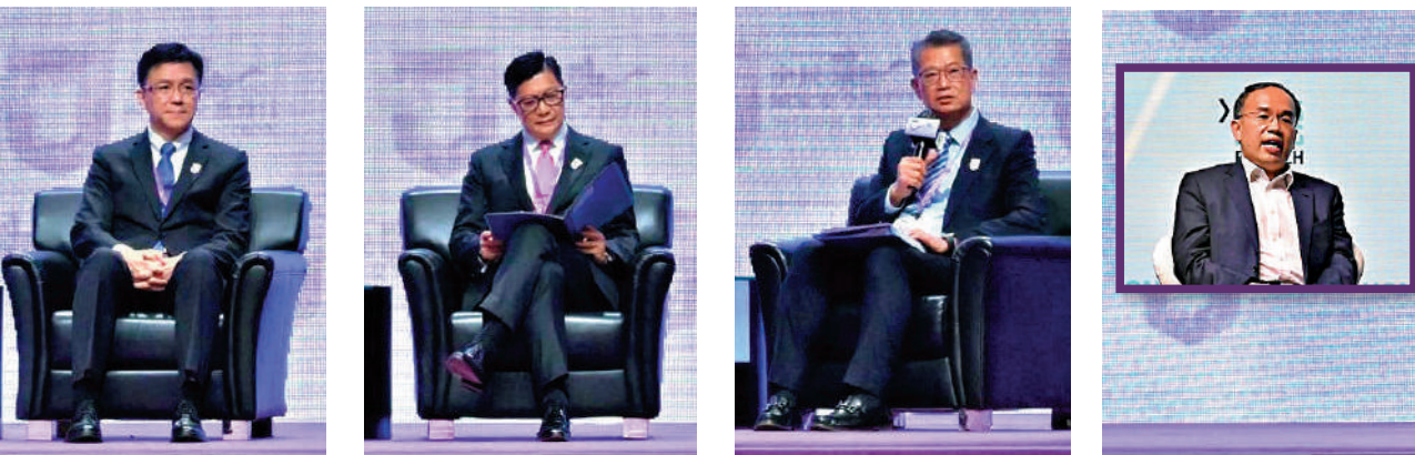
▲財政司司長陳茂波（右）主持「金融安全及網絡安全的挑戰及應對」主題講座。保安局局長鄧炳強（中）和創新科技及工業局局長孫東（左）出席，

鄧炳強指出，必須從情報蒐集、執法、多部門合作、立法及宣傳教育以應對有關風險，其中就基本法23條立法時，會特別注意網絡方面的缺口。正如行政長官