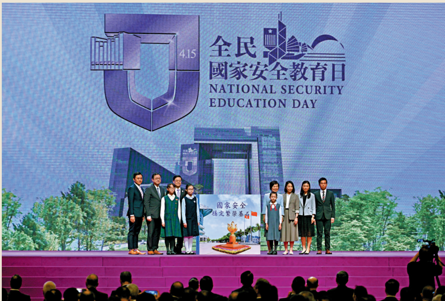
▲「全民國家安全教育日2023」開幕典禮昨日舉行，行政長官李家超等嘉賓為學生進行贈書儀式。