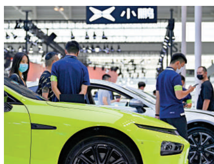
▲眾車股昨日表現興奮，有新消息發布的小鵬急升逾一成二，報44元。

車股昨日表現興奮，小鵬升幅最為突出，其他股份如蔚來（09866）及長城汽車（02333）均升逾6%，分別報76.45元及10.4元；理想汽車（02015）收報101.6元，升5.6%。吉利汽車（00175）升3.75%，收報10.52元；五菱汽車（00305）及比亞迪（01211）均升逾2%，收報0.84元及231.8元。