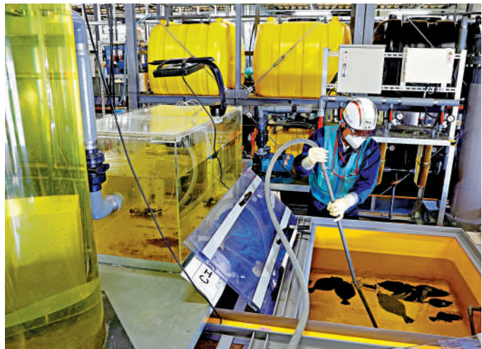
▲韓國嚴禁福島海產品進口，圖為日本工作人員在福島第一核電站進行海洋生物飼養實驗。

【大公報訊】綜合新華社、路透社、《朝日新聞》報道：在日本北海道舉行的七國集團（G7）氣候、能源和環境部長會議16日閉幕。日本經濟產業大臣西村康稔在會後的記者會上聲稱，福島核污水排海行動受到各國的「歡迎」。聽到西村的發言，坐在一旁的德國環境部長萊姆克立即出言反駁，稱德國不能歡迎日本向海洋排放核污染水。