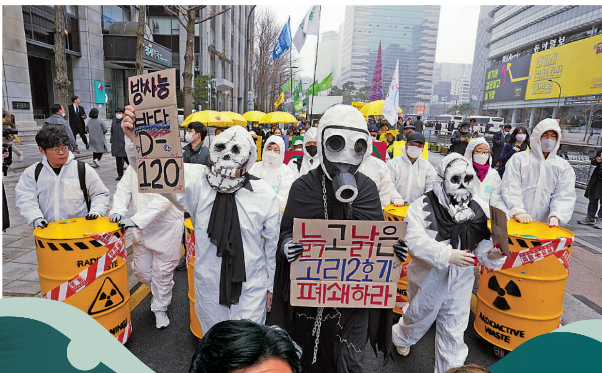
▲3月9日，韓國首爾民眾集會反對日本核污水排海計劃。