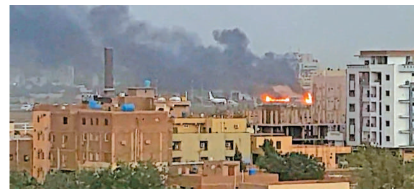
▲17日，喀土穆國際機場的停坪上空飄起煙霧。

東非政府間發展組織（伊加特）16日宣布，已委託南蘇丹總統基爾、肯尼亞總統魯托和吉布提總統蓋萊盡快前往蘇丹，以調解衝突。聯合國安理會17日開會討論蘇丹局勢。