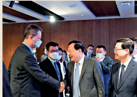
▲夏寶龍與創科界代表和青年科學家交談。