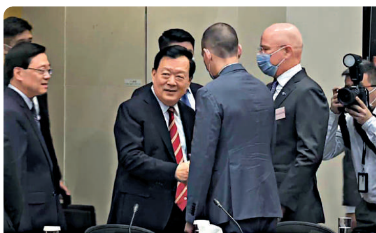
▲夏寶龍昨日與本港及外國商會代表會面。