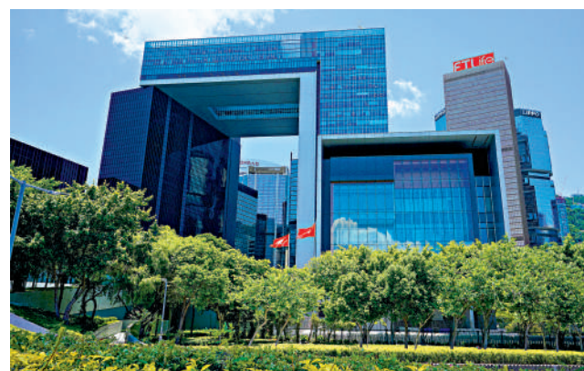
▲夏寶龍昨日早上到政府總部，與商會代表見面交流。