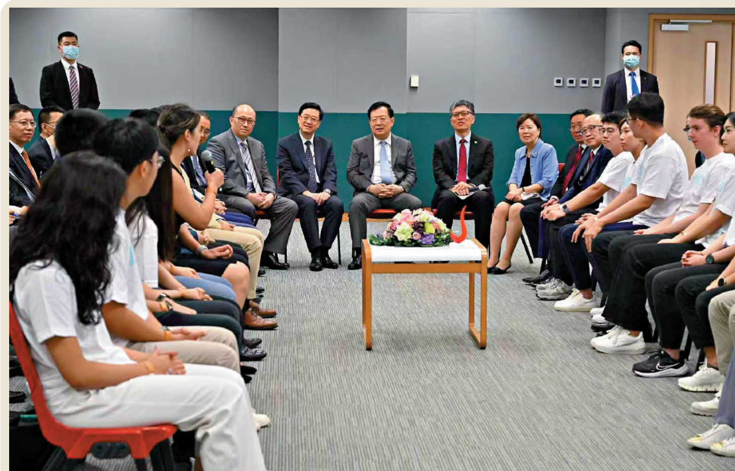
▲國務院港澳辦主任夏寶龍昨日下午前往科學園，了解本港科技發展，其後轉往香港科技大學，與師生交流及參觀實驗室。