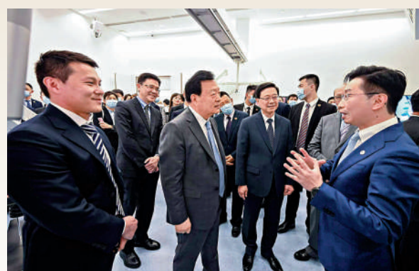
▲夏寶龍考察香港科學園。