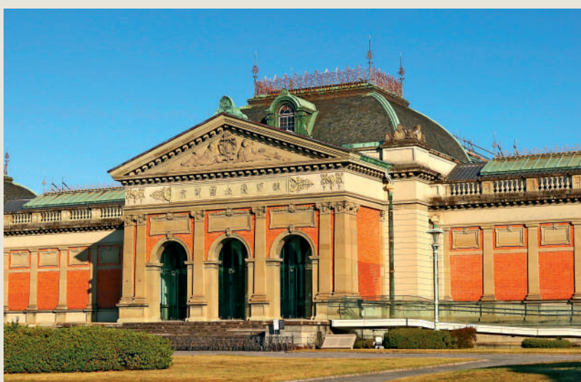
▲日本京都博物館是法國式樣的建築。

另一方面，為了「文明開化」，明治政府極力仿照歐洲國家的模式，為入歐鋪路架橋。為了顯示它與歐洲列強是相同文