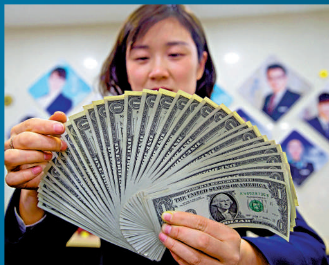
▲中國2月持有美債8488億美元，按月減少106億美元。

中金公司的研報也預計，到今年第二季度末，美國消費物價指數（CPI）與核心CPI增長有望分別回落至3%、4%左右，結合美聯儲3月份點陣圖預測，未來美國加息空間所剩無幾，美國經濟溫和衰退是大概率事件，「美聯儲加息終點或在5%至5.25%以下水平，十年期美債利率或在3.5%左右位置震盪。」