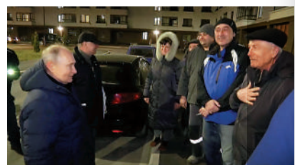
▲普京（左）上月視察馬里烏波爾地區。