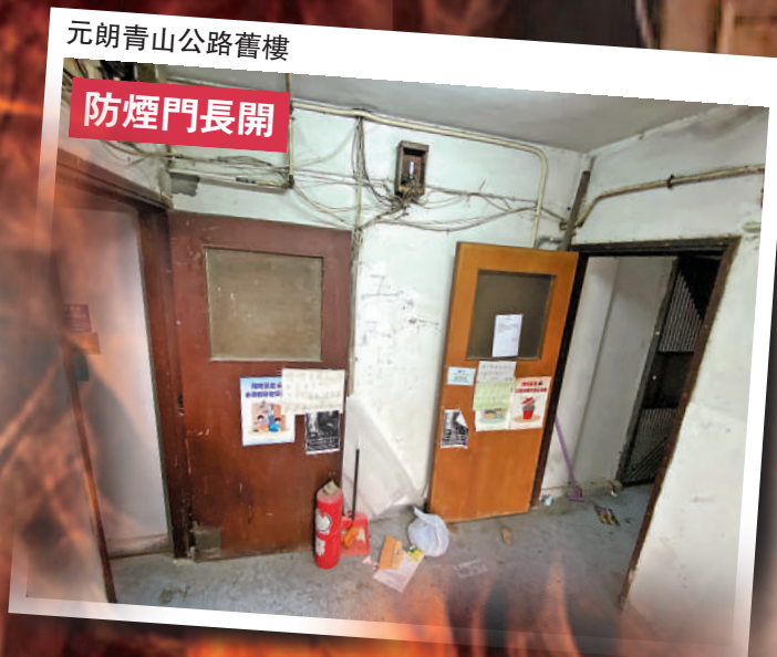
元朗青山公路舊樓