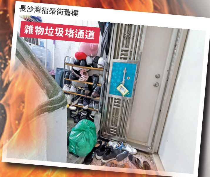
長沙灣福榮街舊樓