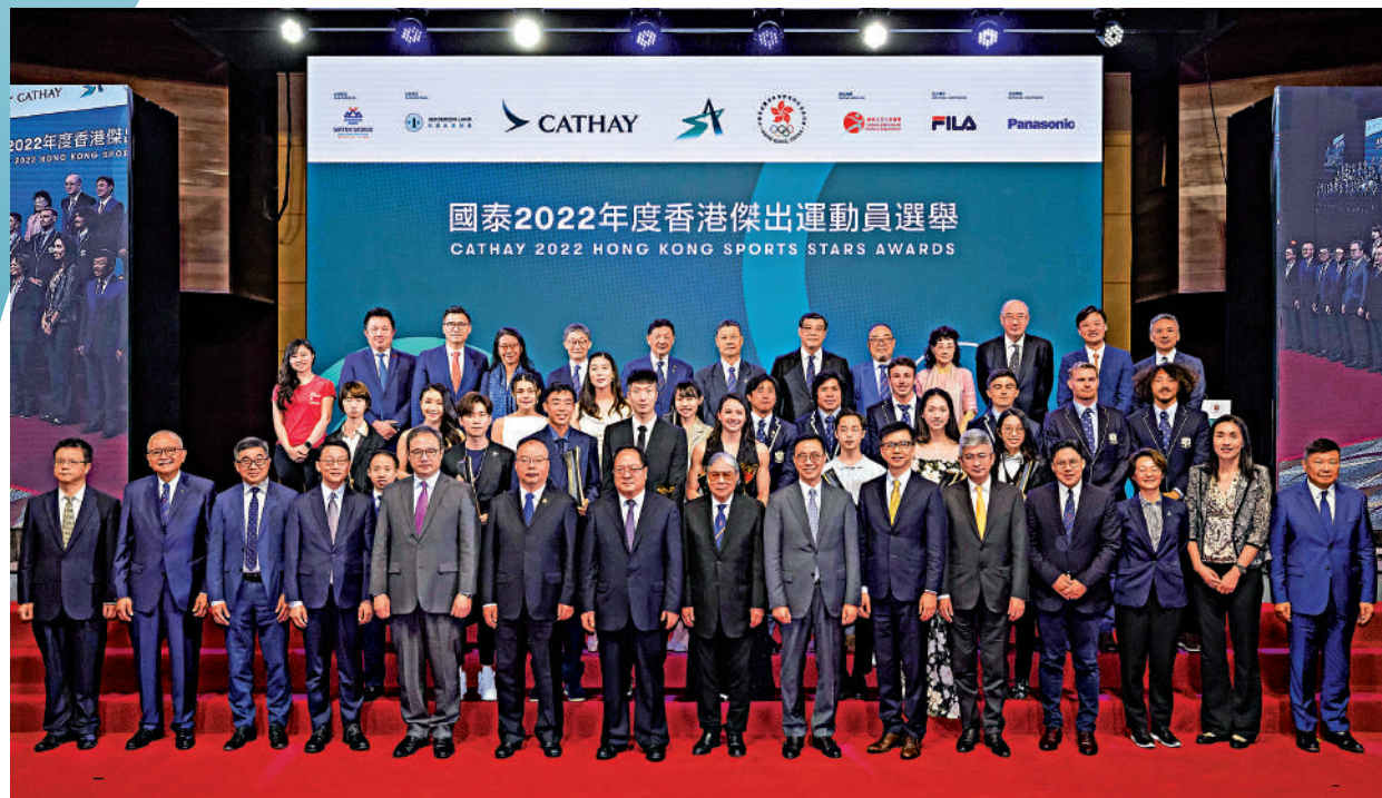
▲嘉賓們與得獎者大合照。