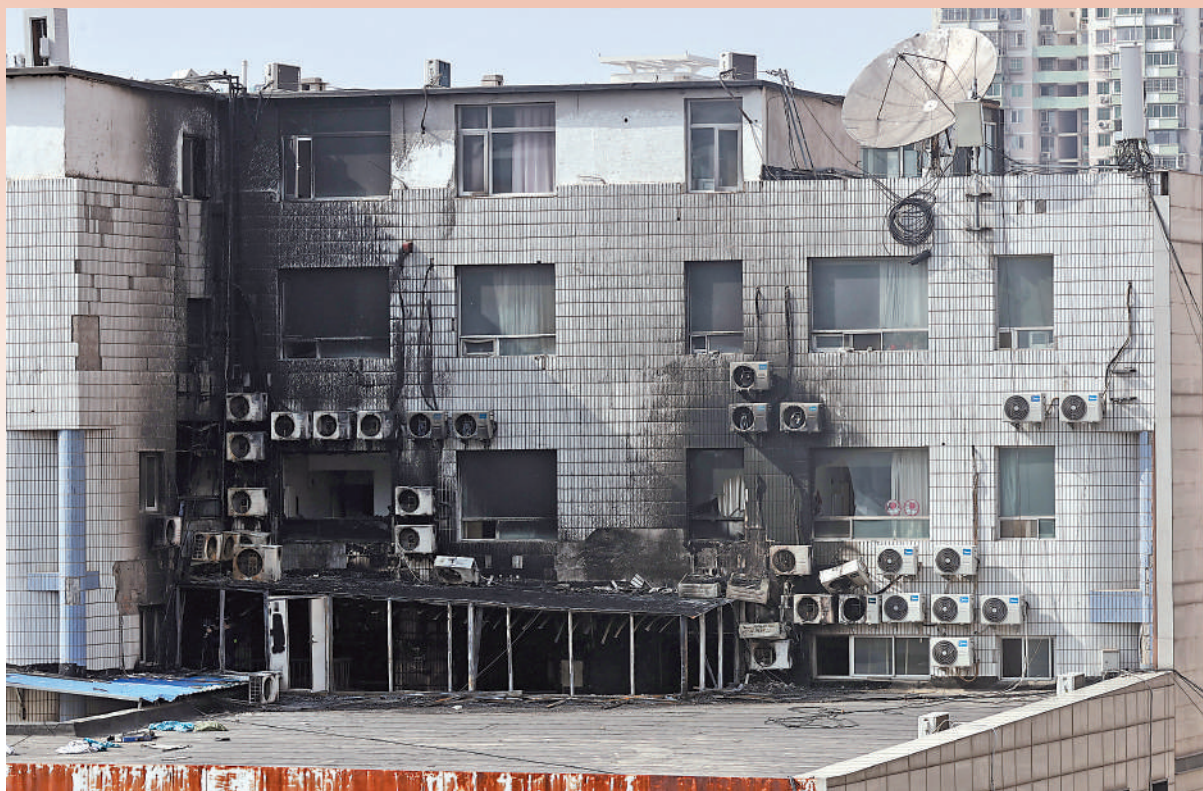
▲4月19日，北京長峰醫院住院部東樓燒焦的窗格和外牆。經初步調查，事故係醫院住院部內部改造施工過程中產生的火花引燃現場可燃塗料的揮發物所致。