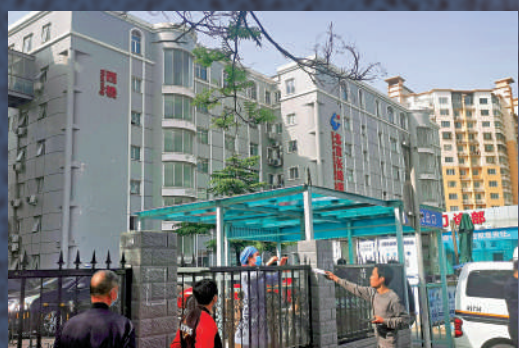
▲4月19日，北京長峰醫院實行封閉管理，院內一位醫務工作者隔着院牆收快遞。