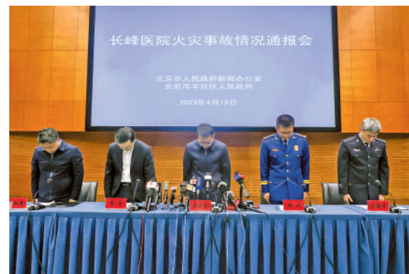
▲4月19日，北京長峰醫院火災事故情況通報會舉行。圖為通報會現場為遇難人員默哀。