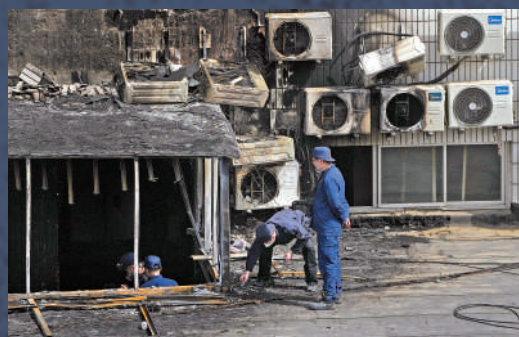
▲4月19日，調查人員來到火災現場，在被燒毀的走廊進行調查。

◀4月18日，北京長峰醫院發生火災後，人們試圖從窗戶逃生，這是從社交媒體視頻中獲得的屏幕截圖。