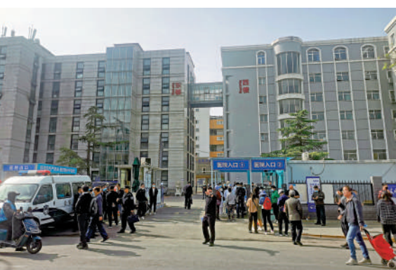
▲4月19日，北京長峰醫院實行封閉管理，有醫院患者家屬從裏面走出。