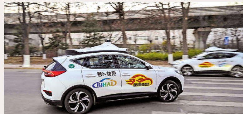
◀ 百度蘿蔔快跑，截至上季末，訂單量已超200萬。

百度創始人、董事長兼首席執行官李彥宏表示：「創新不是閉門造車。創新是你有機會進入市場，不斷獲得用戶和客戶的回饋，摸着回饋過河才能實現的。」