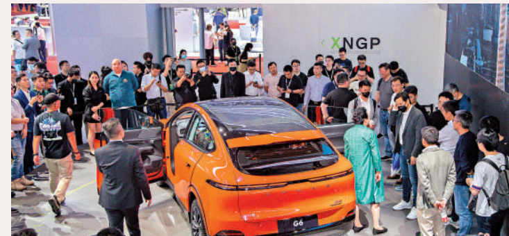
◀ 小米創辦人雷軍昨日現身上海車展，參觀眾多車企展臺。

前一天還在北京主持小米新品發布會，雷軍轉身便「閃現」上海，市場人士估計，雷軍此行是為即將走向量產的小米汽車進行市場調研。