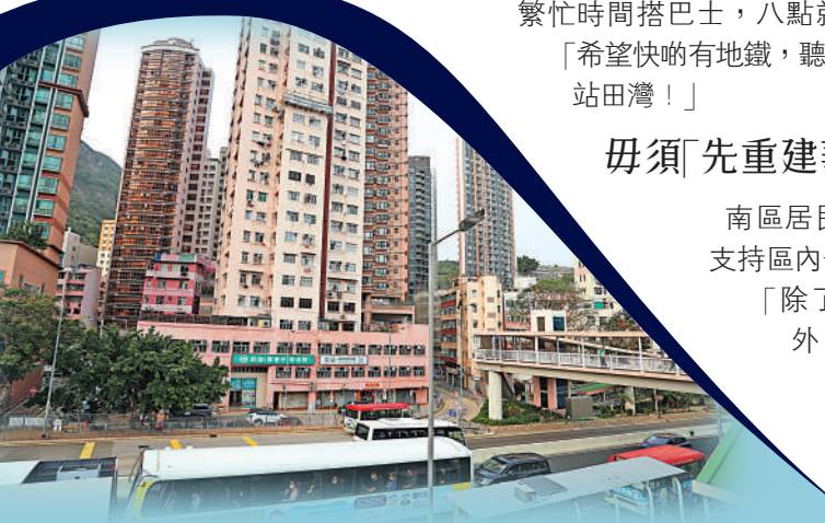
▲規劃中的港鐵田灣站，只需要三分鐘就可到達香港仔魚市場。