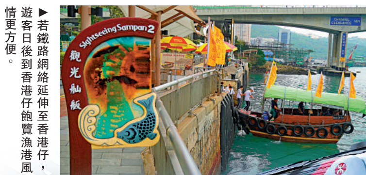
若鐵路網絡延伸至香港仔，遊客日後到香港仔飽覽漁港風情更方便。