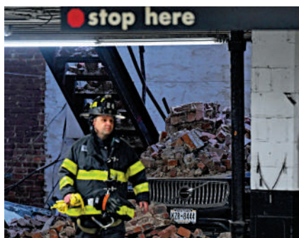
▶消防人員抵達事故現場。

紐約市長亞當斯稱，事故發生之前，這座停車場並無建築違規記錄。屋宇署的工程師正在檢查鄰近建築是否安全，並調查事故原因。