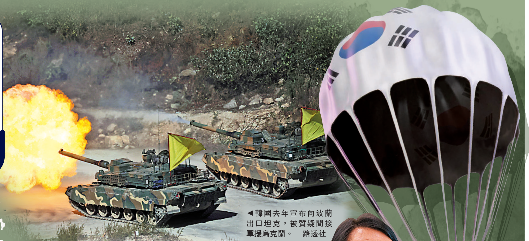
◀韓國去年宣布向波蘭出口坦克，被質疑間接軍援烏克蘭。路透社

【大公報訊】綜合路透社、韓聯社、《中央日報》報道：韓國總統尹錫悅將於下周訪美，他在行前接受媒體專訪稱，如果烏克蘭發生針對平民的大規模襲擊，韓國或不再堅持只提供人道主義援助和經濟援助的原則。評論指，這是尹錫悅政府首次暗示可能改變不向烏克蘭提供軍援的立場。俄羅斯19日警告指，軍援烏克蘭意味着間接參與俄烏衝突。俄聯邦安全會議副主席梅德韋傑夫稱，若韓國向烏克蘭提供武器，俄方將「以牙還牙」，把最先進的武器送到朝鮮。