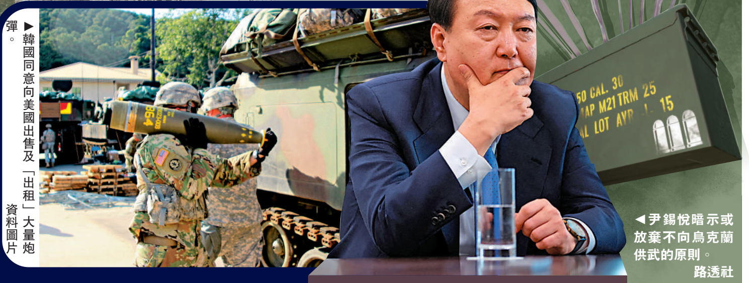
◀尹錫悅暗示或放棄不向烏克蘭供武的原則。

俄烏衝突爆發後，韓國趁機擴大武器出口，去年武器銷售額比前年多出逾一倍。去年7月，韓國與北約成員國波蘭達成軍售協議，出口980輛坦克、648門自走炮和48架戰機。俄總統普京批評說，韓國實際上通過波蘭間接向烏克蘭提供武器。