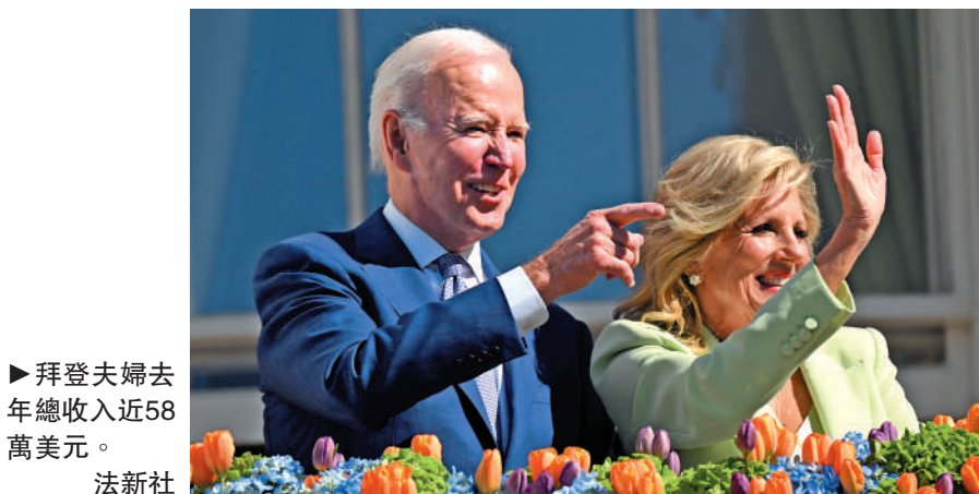
▶拜登夫婦去年總收入近58萬美元。

烏副總理庫布拉科夫19日稱，根據從烏克蘭黑海港口出發的救物出口安全協議，對相關船隻的檢查即將恢復。該協議旨在保障烏克蘭糧食出口，緩解全球糧食短缺。俄烏雙方互相指責對方阻礙協議落實。由於烏克蘭的小麥等穀物出口受阻，全球對大米的需求激增，但巴基斯坦等大米出口國受到洪災等極端天氣影響，收成減少。惠譽解決方案公司警告指，今年全球大米市場將出現20年來最嚴重的短缺。