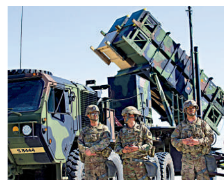
▲烏克蘭19日證實已收到首套「愛國者」系統。資料圖片

美方和德方的相應培訓。俄烏兩軍繼續爭奪烏東城鎮巴赫穆特的控制權。烏方18日稱，俄軍對當地