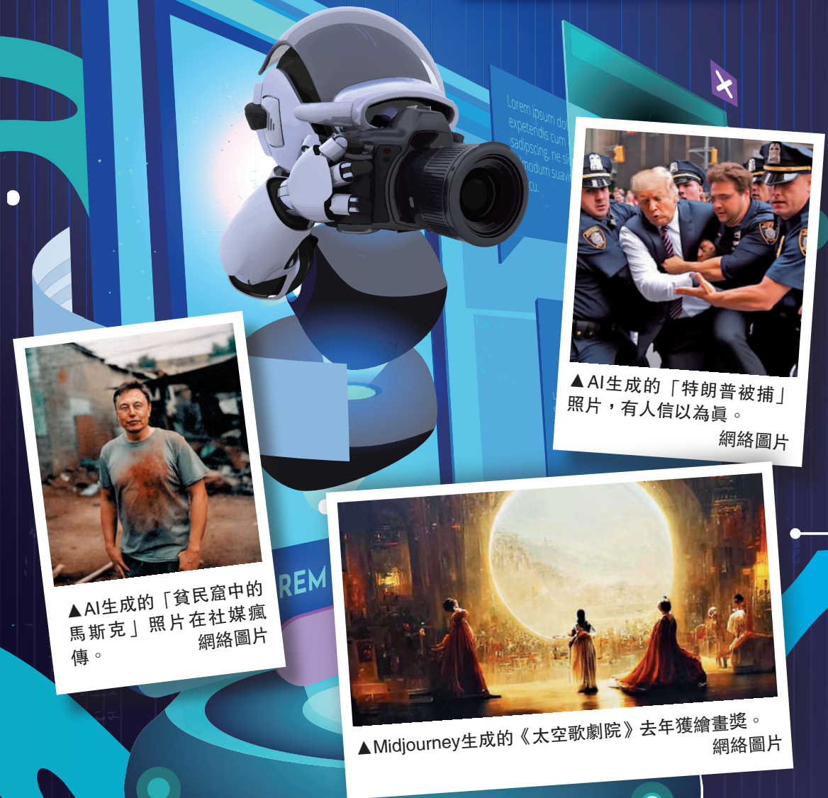
▲AI生成的「貧民窟中的馬斯克」照片在社媒瘋傳。